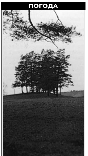
Температура воздуха в Орле и по области +3°, +5°, без существенных осадков.

ципального лицея №1 им. М.В. Ломоносова г. Орла побываемые воспоминания: первая учительница, первое окончание учебного заведения, они вновь смогут погрузиться в атмосферу своего детства: на днях здесь открыт музей школы, где можно проследить весь цикл становления образовательного учреждения от Николаевской женской гимназии до наших дней.