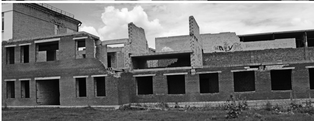
Так уже много лет выглядит пристройка к Должанской школе

ники внешне выглядит неплохо. Но когда заходишь внутрь, то понимаешь: работы здесь в несколько раз больше, чем уже сделано.