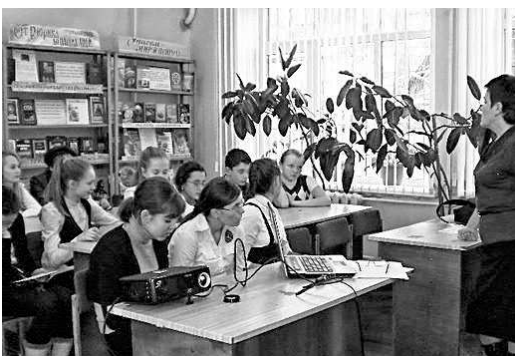
Читатели библиотеки имени Блынского узнали о жизни героических земляков

— Для современной молодёжи героем должен стать не тот, кто стремится к собственной выгоде и безопасности, а тот, кто готов пожертвовать жизнью ради независимости