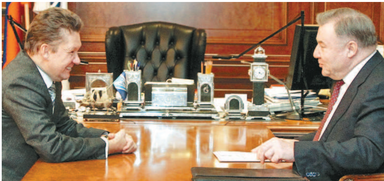
Встреча прошла в теплой и дружественной обстановке

«ГАЗПРОМ» ВКЛАДЫВАЕТ ИНВЕСТИЦИИ В ЭКОНОМИКУ ОРЛОВЩИНЫ