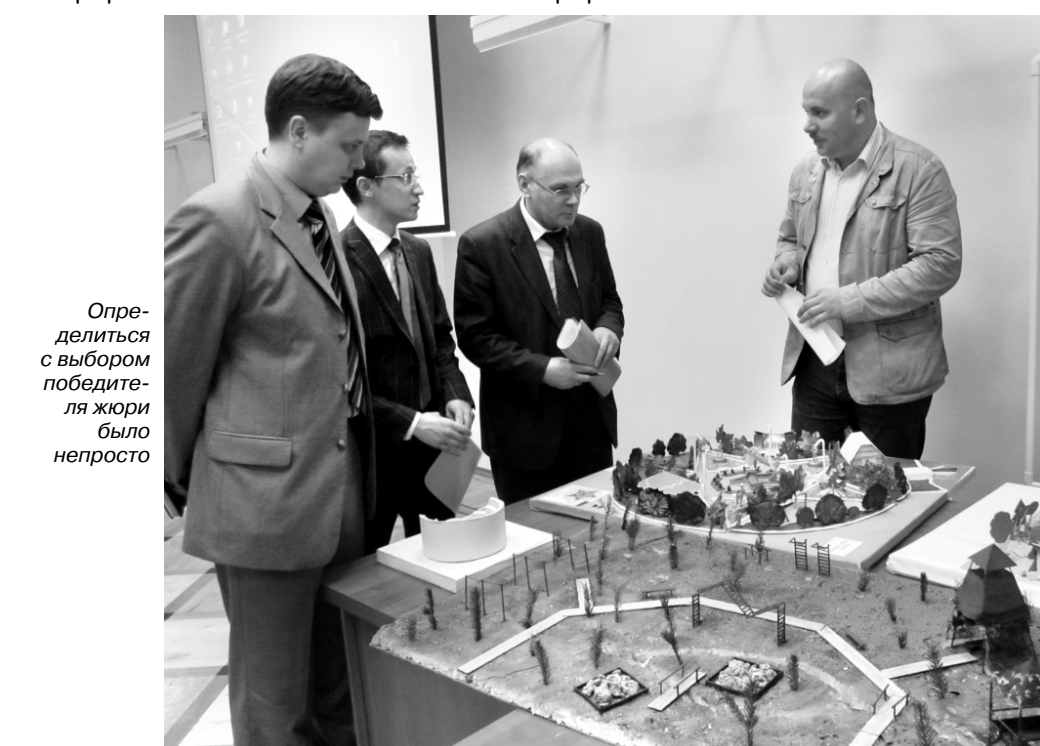
Определиться с выбором победителя жюри было непросто

Сама композиция с высотными деревьями и цветами выглядит, как огромный яркий цветок. Дорожки будут