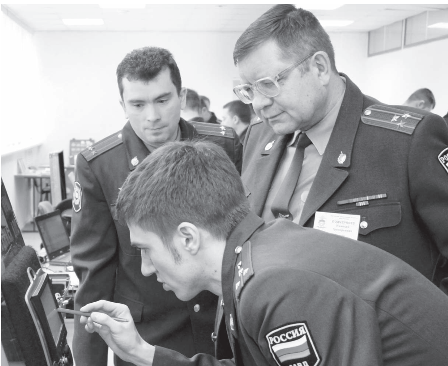
Новинки спецтехники для нужд Госавтоинспекции заинтересовали не только студентов, но и опытных преподавателей

В рамках конференции в институте открылась выставка новинок спецтехники, которые делают движение на дорогах безопаснее.