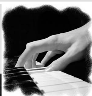
Серёжа Дубовской: — Научиться играть на пианино