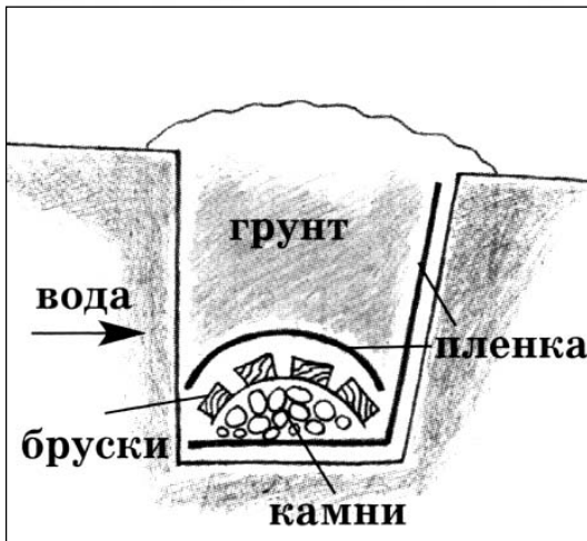
Устройство дренажной канавки.

Тогда я вырыл на участке открытые дренажные канавки, по которым направил воду в отводные ямы, сделанные в более низких местах. Однако края этих канав быстро осыпались и заросли сорняками. Дренаж требовал постоянного внимания, а ощутимого эффекта не давал. Узнал, как делают соседи.