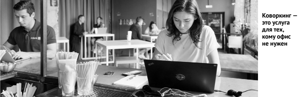
Коворкинг — это услуга для тех, кому офис не нужен