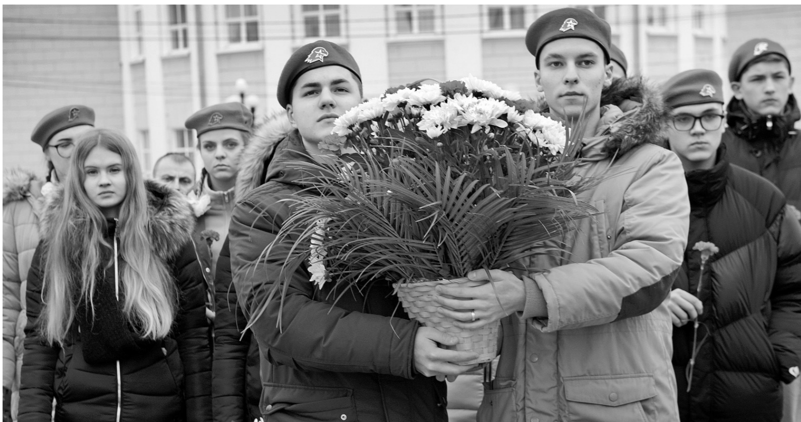
Память о героях Отечества передаётся из поколения в поколение