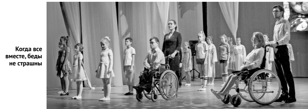
Когда все вместе, беды не страшны

— Работа ведётся большая и каждодневная, — сказала руководитель департамента социальной защиты населения, опеки и попечительства