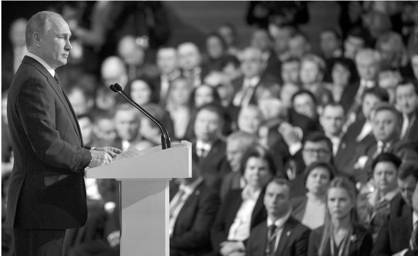
В ПАРТИЯХ И ДВИЖЕНИЯХ

В этот день прошёл форум в формате дискуссионных площадок, которые были посвящены реализации разделов программы партии за 2018 год. На площадке «Экономика роста» речь шла о развитии бизнеса в новых условиях налоговой системы, национальных проектах и региональном развитии. На площадке «Качество жизни» были затронуты вопросы развития социального волонтерства, борьбы с онкологическими заболеваниями, а также подготовки кадров для новой экономики. Площадка «Городская среда и чистая страна» была посвящена созданию комфортной городской среды, дальнейшему развитию программы переселения из аварийного жилья, а также формиро-