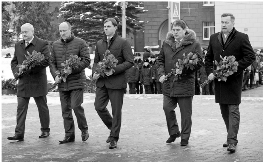
Живые цветы — символ памяти и уважения к подвигу героев