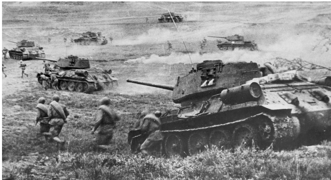
Сорок третий горечью поминной на меня пахнул издали...

По роду своей тогдашней работы (обком партии) я сопровождал гостей в поездке по Орловщине, был сви-