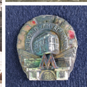
Знак строителя Московского метрополитена