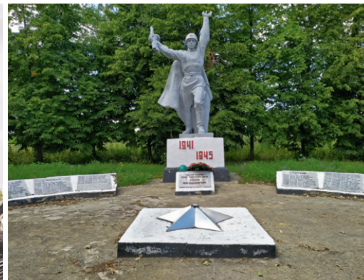
Мемориал воинам Великой Отечественной войны в деревне Никольское