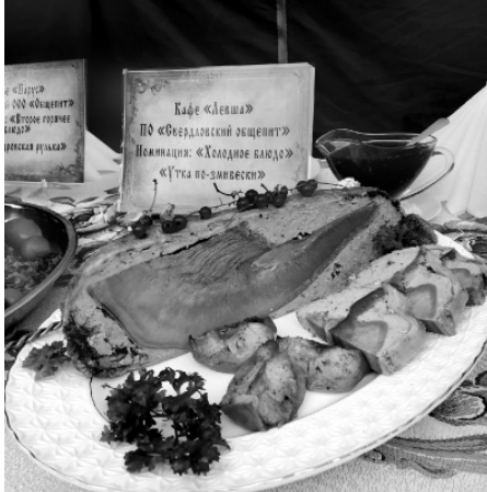
Таким блюдом угощал своих гостей Николай Лесков