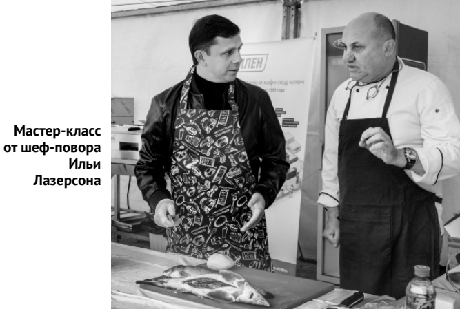
Мастер-класс от шеф-повара Ильи Лазерсона