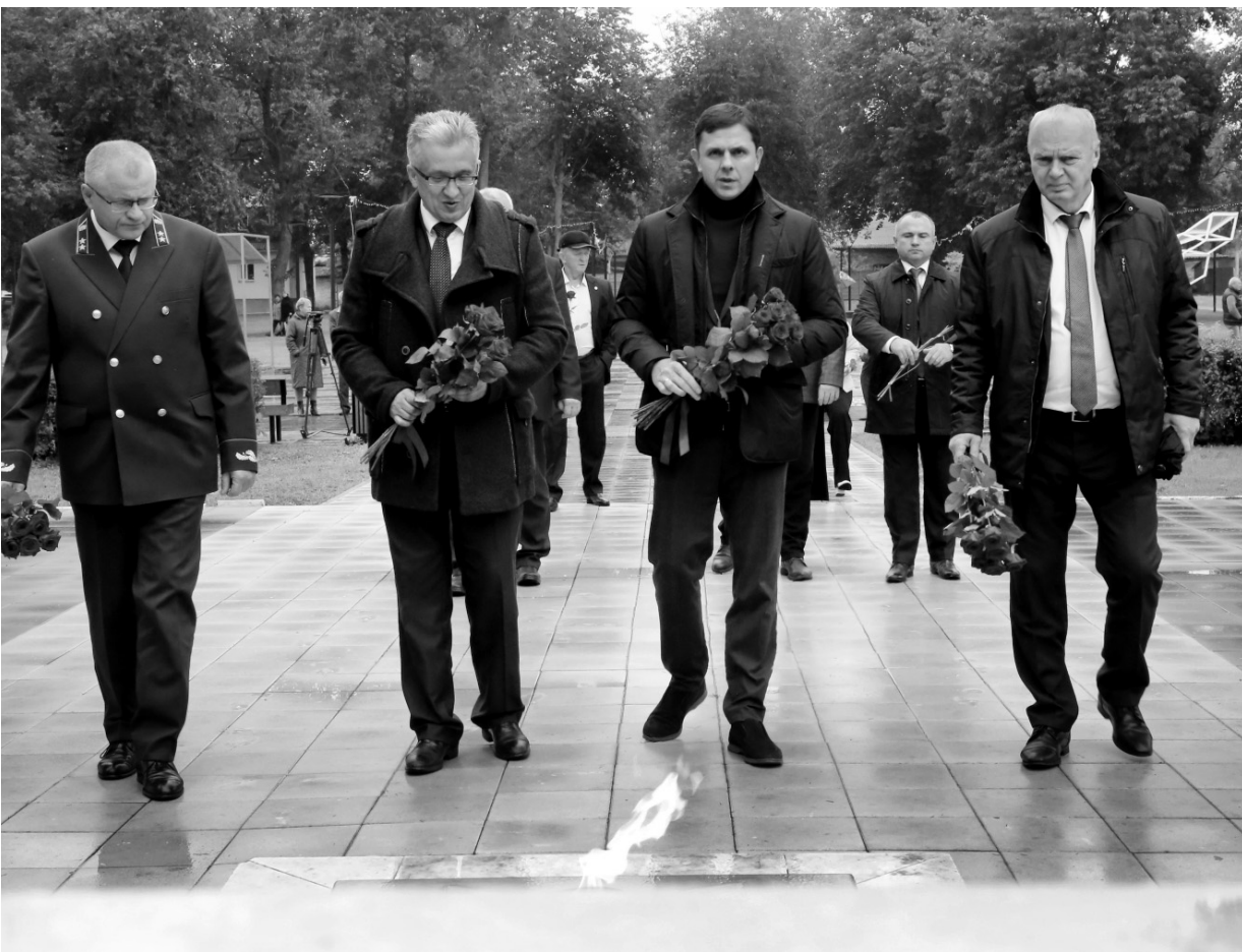
Живые цветы — дань памяти защитников Родины