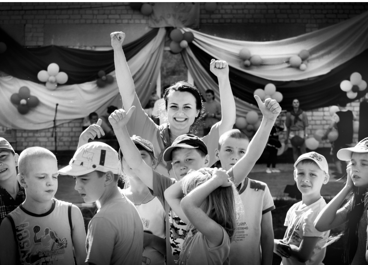
Лето — это маленькая жизнь

Депутаты обсудили и вопрос о ремонте Орловского музея изобразительных искусств, который располагается в здании, являющемся объектом культурного наследия. С 2008 года оно находится в предаварийном состоянии. По информации начальника управления культуры