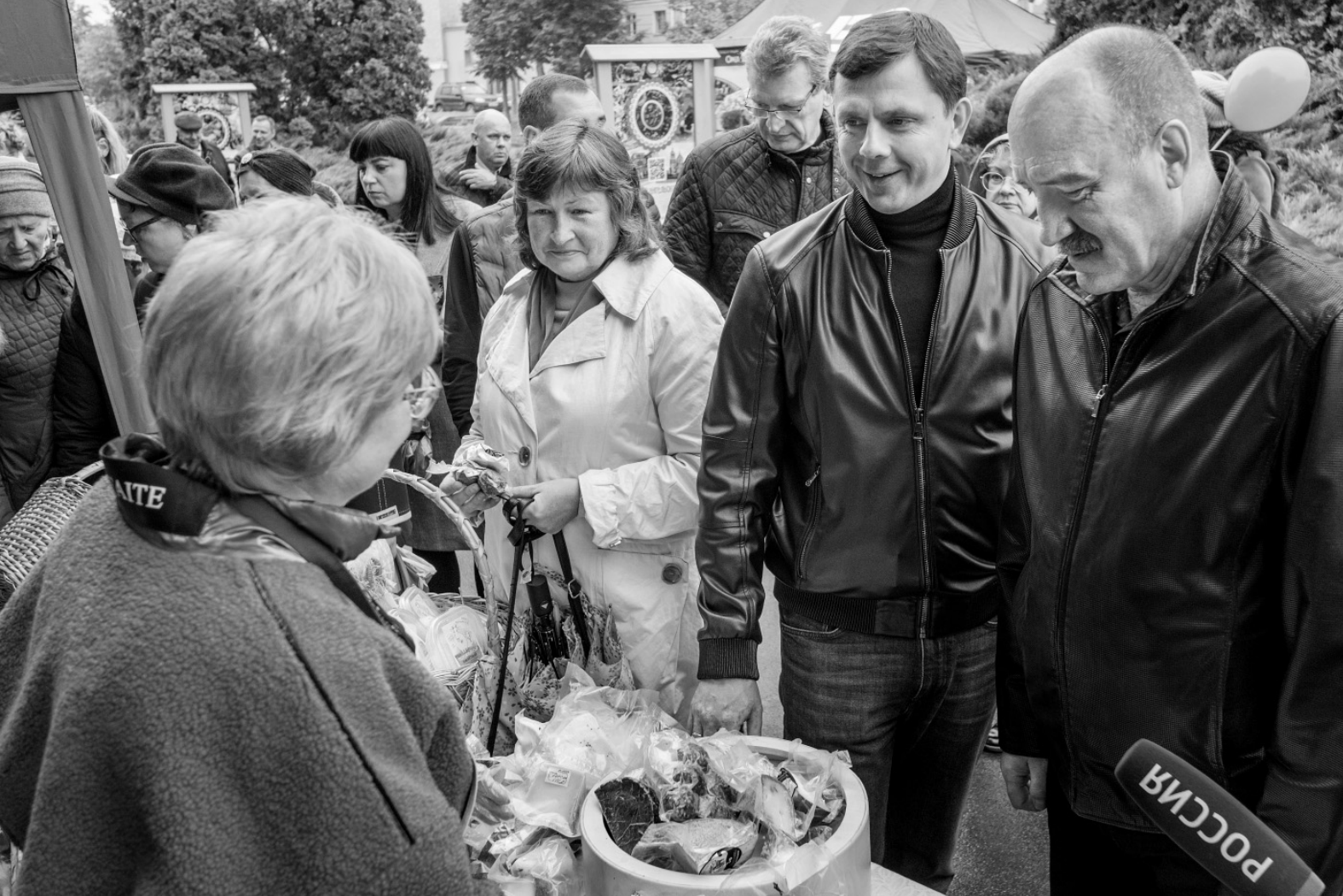
Орловским производителям есть чем удивить самого взыскательного потребителя