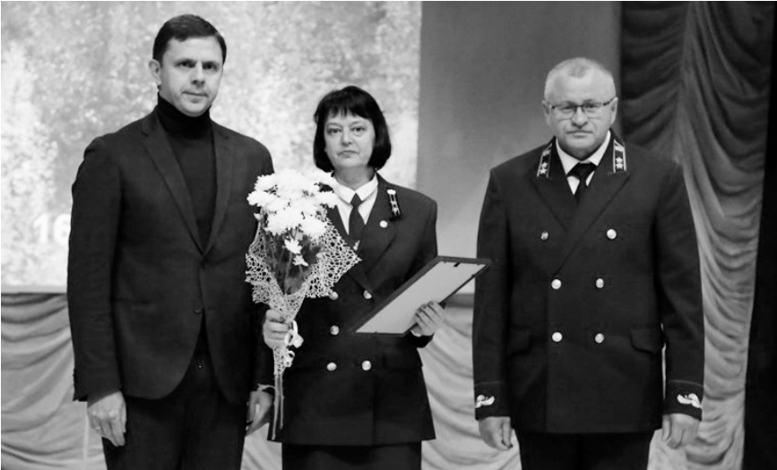
Награда лучшим — за сохранение лесов