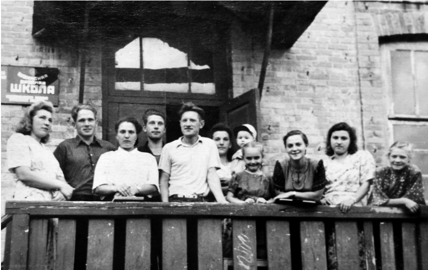
Здание Шенинской школы и коллектив учителей второй половины XX века