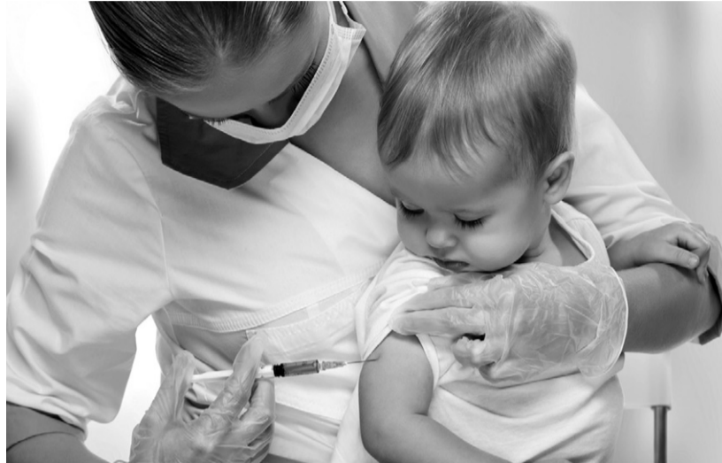
Чтобы не заболеть, нужно потерпеть

— Нет. Мы не питаем иллюзий в этом плане. По данным лабораторных анализов, на территории региона