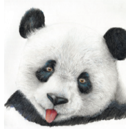
Панда — само объяснение

место. В 2014 году участвовал в Неделе искусств в Португалии и в номинации «Академическая графика. Рисунок» занял второе место. В 2016 году выставка «Отражения» получила признание Российской академии художеств. Президент