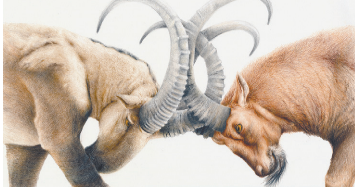
Басня «Два козла»

За свой проект художник-анималист уже получил несколько престижных наград: например, в 2013 году на международной выставке, проходившей в рамках Российской недели искусств, в номинации «Экспериментальная графика. Анималистика» занял первое