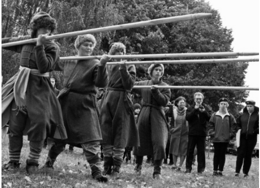
За честь Отчизны мы стоим!

например, были воины петровского времени в камзолах, ботфортах и треуголках и участники