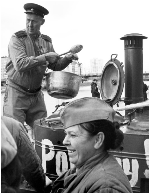
Хороша солдатская каша!

— Историю надо изучать не только по учебникам, но и с помощью исторических реконструкций. История, ожившая на глазах благодаря усилиям увлечённых людей, станет ближе и понятнее нашим современникам. И гораздо интереснее!