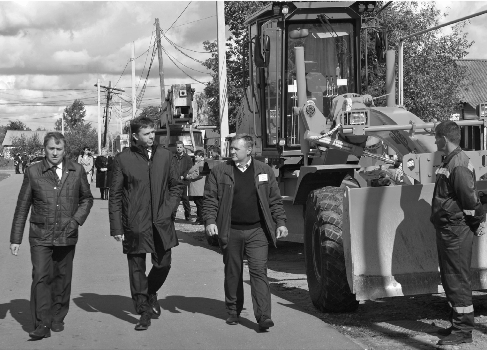
МУП «Жилкомхоз» Должанского района уже два года обновляет технику