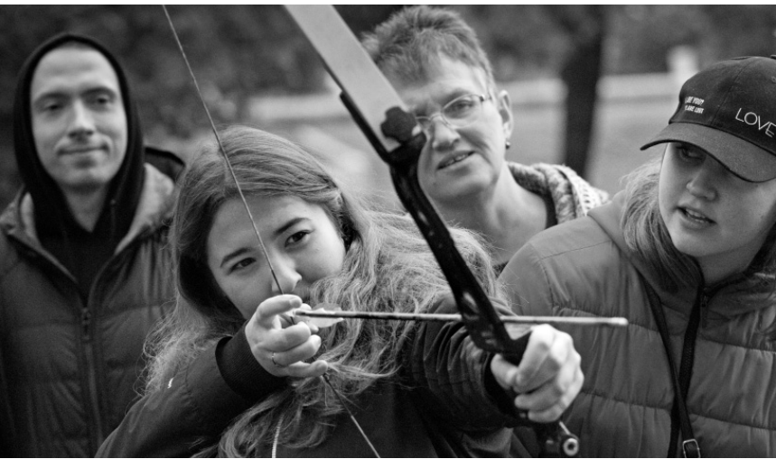
История оживает на глазах

Учредители: Правительство Орловской области, Орловский областной Совет народных депутатов, Государственное унитарное предприятие Орловской области «Орловский издательский дом» (издатель).