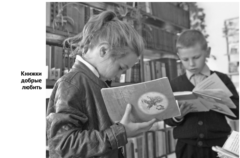
Книжки добрые любят