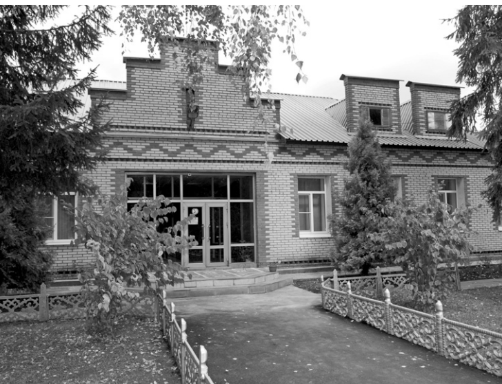
Муниципальная гостиница есть не в каждом районе

«За 2017—2018 годы в Должанскую ЦРБ было поставлено два автомобиля скорой медицинской помощи, в этом году ожидается поставка ещё одного.