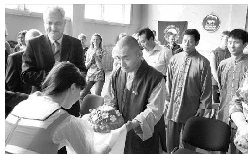
С 1 по 3 мая в Орле во Дворце спорта стадиона им. Ленина прошли международные соревнования по ушу на призы ОРО партии «Единая Россия».