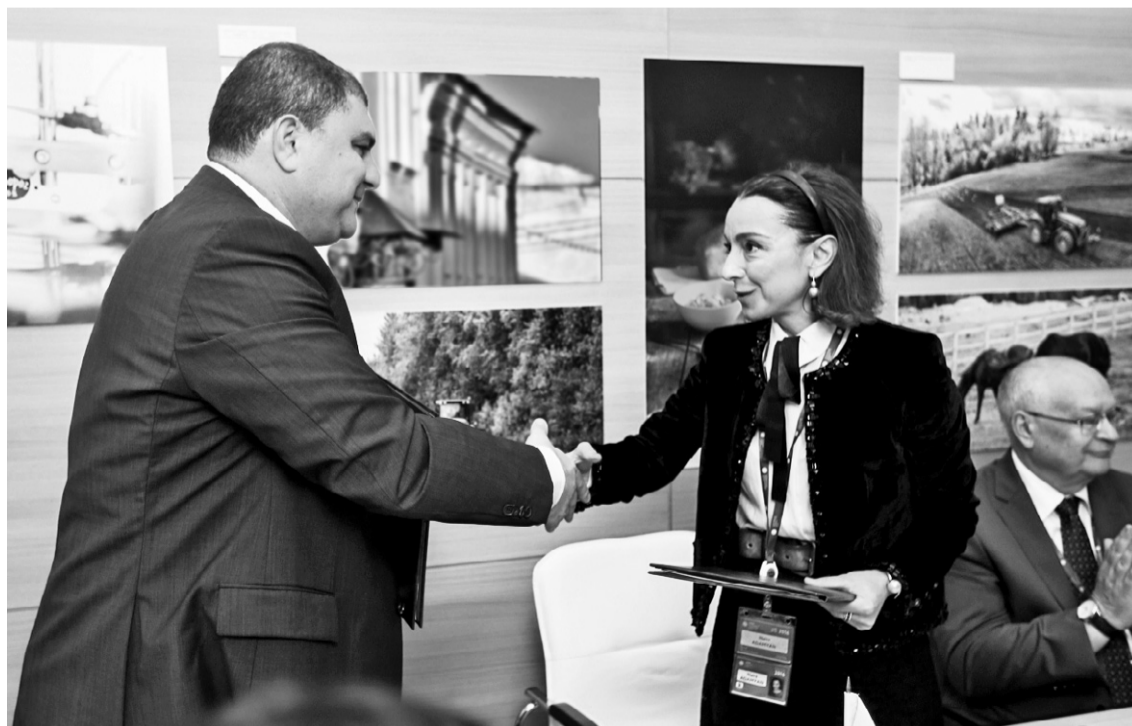
Подписание договора между Орловской областью и АО «Санофи Россия» открывает новую страницу партнёрских отношений

зованием банковских карт и финансово-экономический консалтинг.