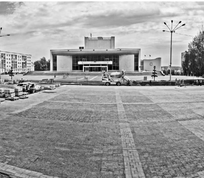
Главная площадь города преобразится на глазах

чены в программу ремонта. Сейчас активно ведутся работы на многих улицах. К примеру, в Северном районе на улицах Рошинской, Раздольной, Михалицына, Металлургов. Кстати, на улице Металлургов за-