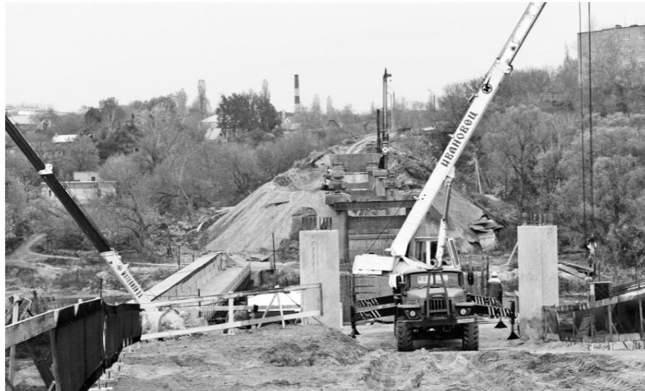
Мост сдадут весной 2017 года