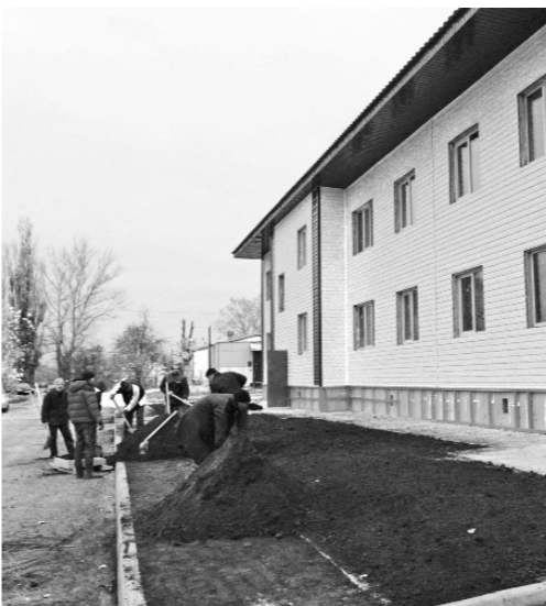
Жильцы справят новоселье в конце ноября