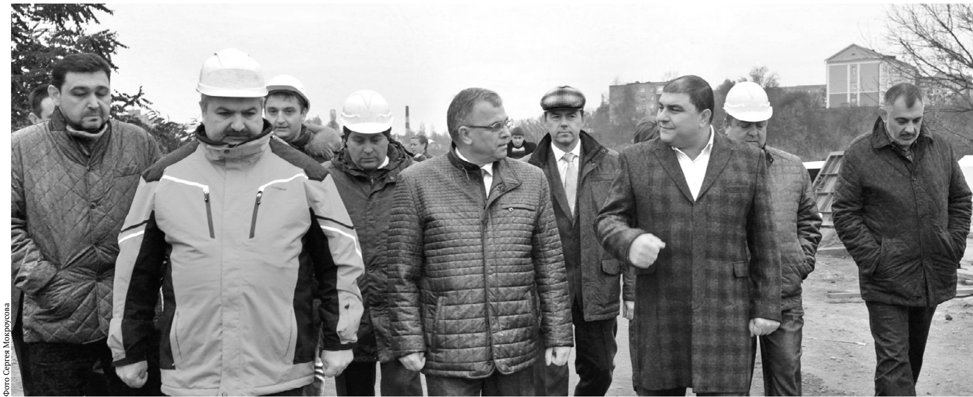
Губернатор доволен темпами строительства моста