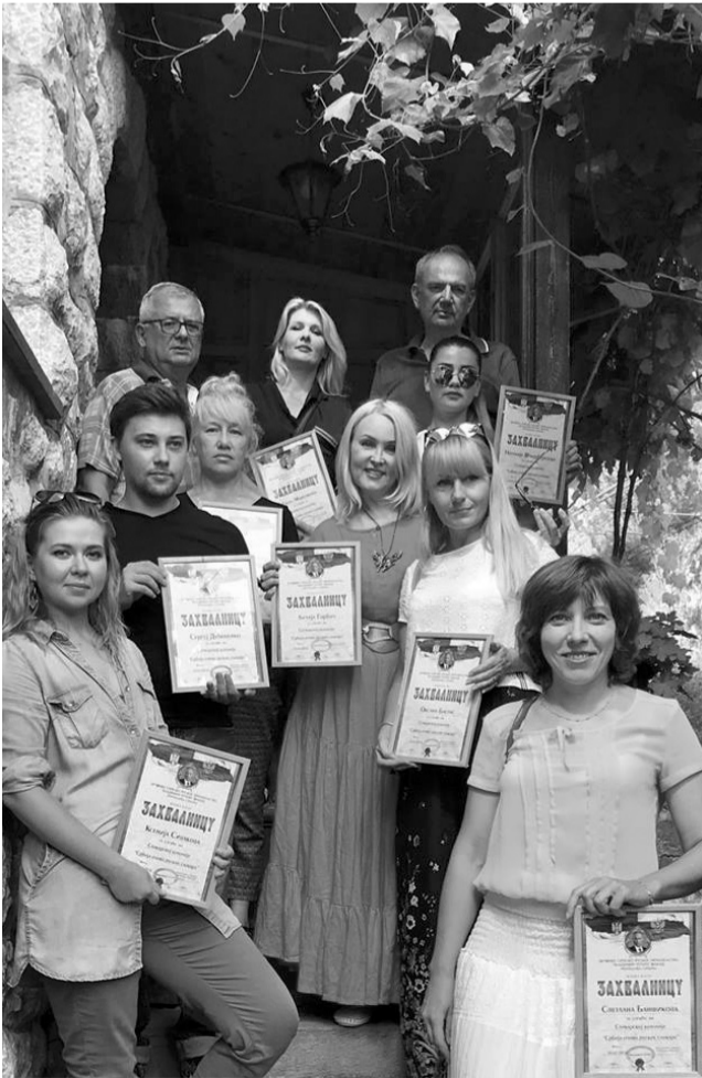
Русских живописцев в Сербии ценят