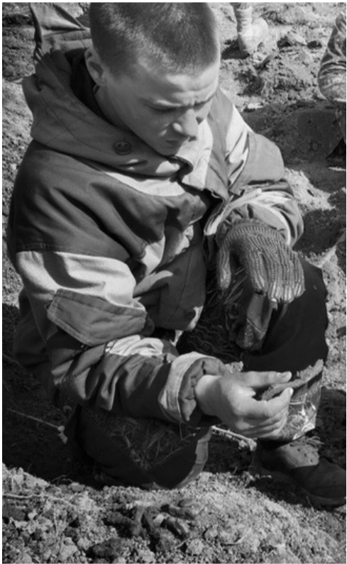
Война не закончена, пока не захоронен последний солдат