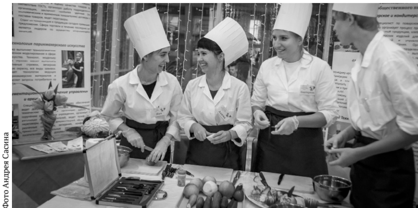
Студенты Орловского техникума сферы услуг, как всегда, готовы удивлять

Работа форума продлится три дня. На площадках ТМК «ГРИНН» пройдут секции по актуальным темам, волнующим современную молодёжь. В их числе: «Добровольчество региона: векторы и тренды развития», «Участие добровольцев в поиске пропавших людей», «Профилактика