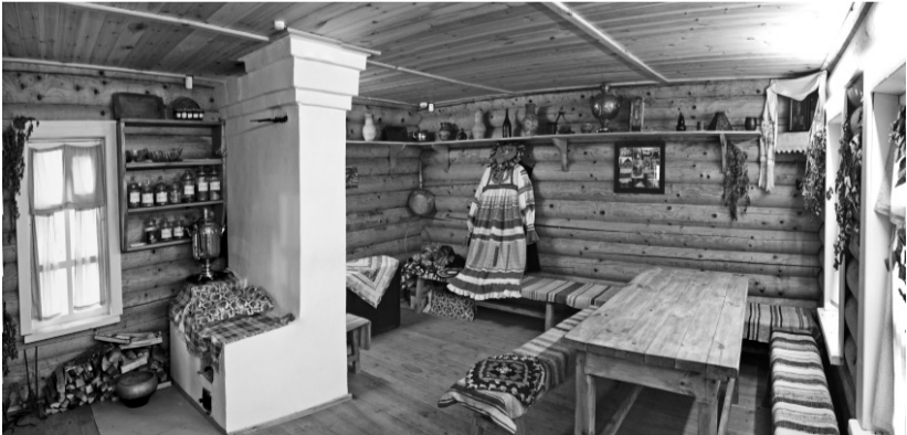
Этно- графическая экспозиция «Приметы милей старин»

ний и создавались произведе- ния, вошедшие в сокрови- щницу русской и мировой литературы. На презентации музей- заповедник И. С. Тургенева «Спасское-Лутовиново» представил коллекцию ред- ких фотографий, среди кото- рых фотопортреты И. С. Тур- генева и его современников, снимки городов и памятных мест Орловской губернии, связанных с жизнью и твор- чеством писателя, любитель- ские фотографии, запечатле- вшие жизнь орловских уса-