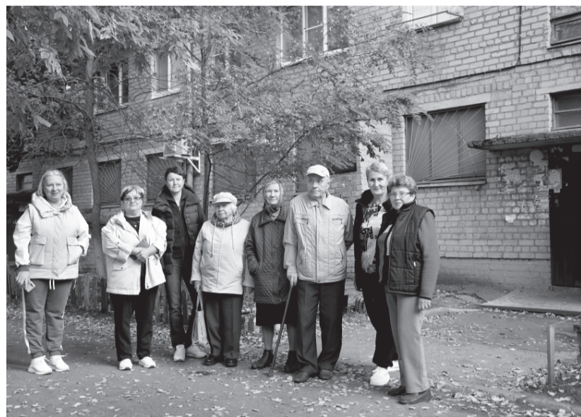
Претензии к «Умному дому» есть у всех жителей. Они хотят сменить управляющую компанию

Посчитав, во сколько им обойдётся приведение двора в порядок, люди сами вышли в сентябре на субботник. А потом возмущались: не понимая, за что же тогда ежемесячно платят? Вообще к управляющей ком-