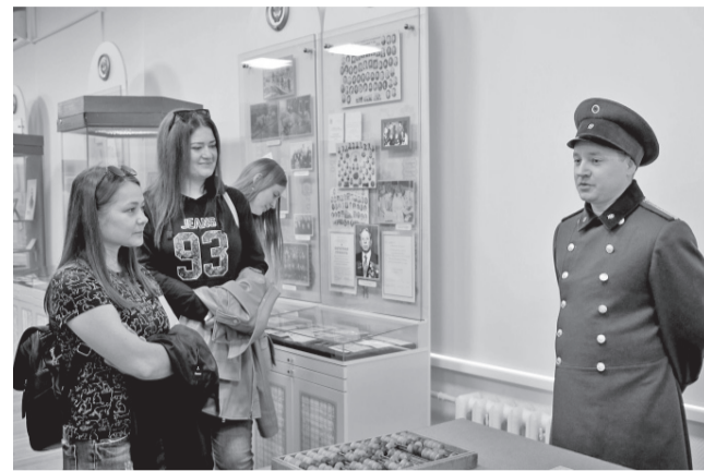
Фото Отделения Банка России по Орловской области

Музей Отделения Банка России по Орловской области стал одним из лучших корпоративных музеев страны.