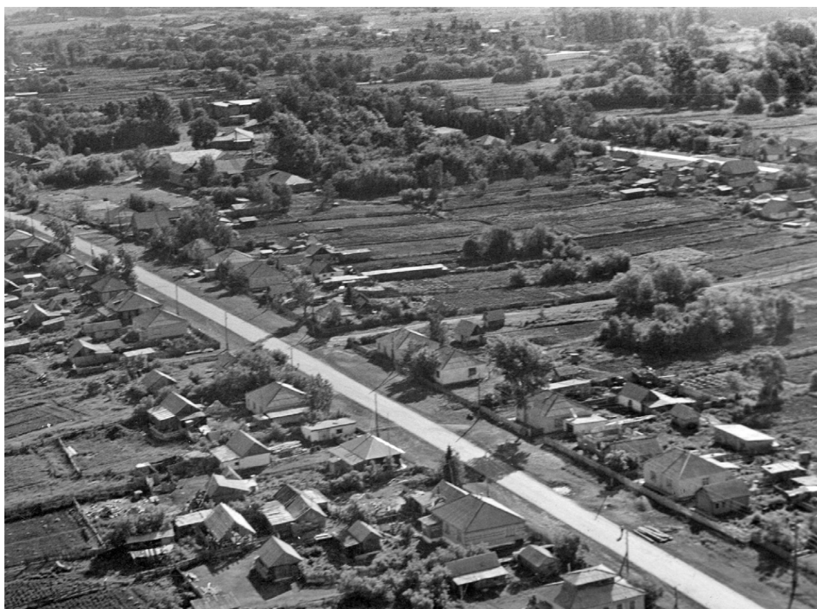
Жилищный конвейер работал со сбоями