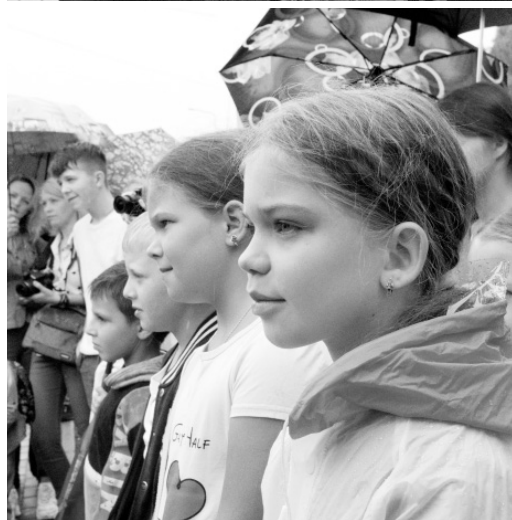
Главные на празднике — дети