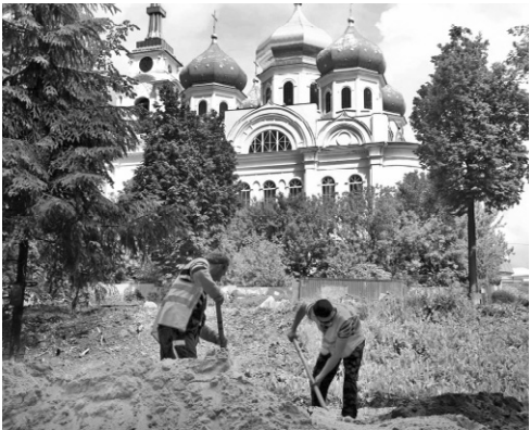
Так будет выглядеть парк культуры и отдыха после реконструкции

А вот установка качелей-пергол «Омега» уже завершена. Прочная железная конструкция для безопасности и красоты облачена в деревянный короб и разделена на три части.