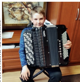
Фото из газеты «За изобилие»