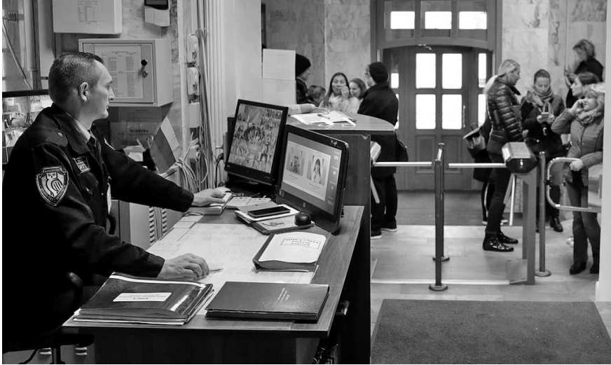
Школы должны стать зоной стопроцентной безопасности

12 октября на заседании комитета областного Совета по образованию, спорту, культуре и туризму депутаты обсудили актуальный вопрос безопасности детей в образовательных организациях.