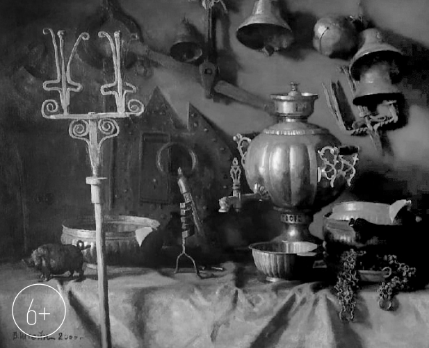
Натюрморт со старинными предметами