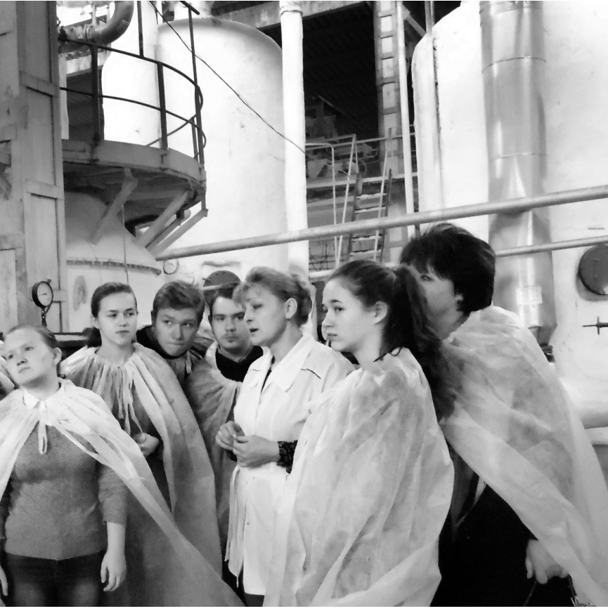
Экскурсия школьников на Залегощенский сахарный завод