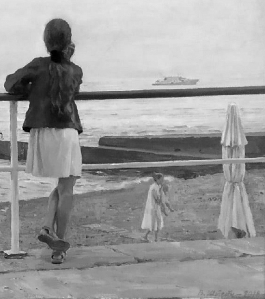
«Скоро в школу»