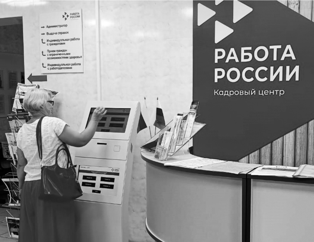
Терминал электронной очереди — это компас, помогающий посетителям найти конкретного специалиста и сэкономить время

— Проведена огромная работа: обновлено техническое оборудование, разработан дизайн-проект, подготовлена проектно-сметная документация на капремонт, проведение её государственная экспертиза, заключён договор с ПАО «Ростелеком» о производстве монтажа локально-вычислительной сети, сейчас закупается мебель. Полным ходом идёт капитальный ремонт. Сотрудники центра занятости и их клиенты терпят временные неудобства в связи с уплотнением кабинетов и с нетерпением ждут перемен во внешнем облике центра. Окончание ремонтных работ планируется в конце ноября. Добавлю, что ещё до этих внешних перемен, центр занятости населения Заводского района начал внедрять принципы бережливого производства, направленные на повышение качества услуг и производительности. Так, в центре добились сокращения времени, необходимого для того, чтобы внести данные соискателя в базу по поиску работы; ввели удобную навигацию