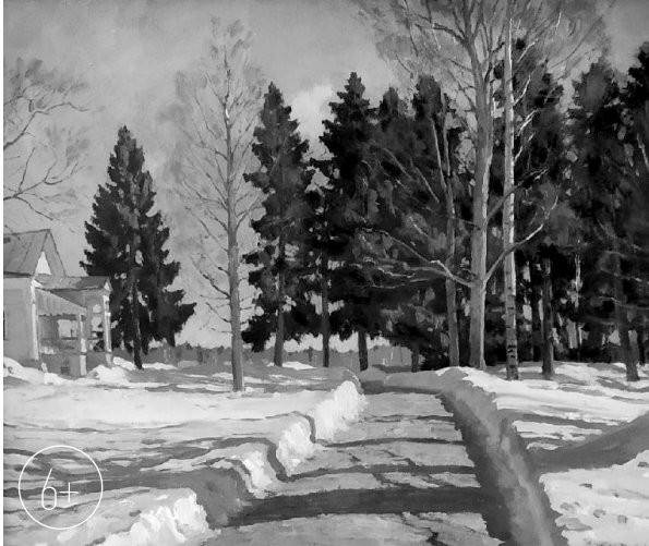
«Мураново. Синие тени»