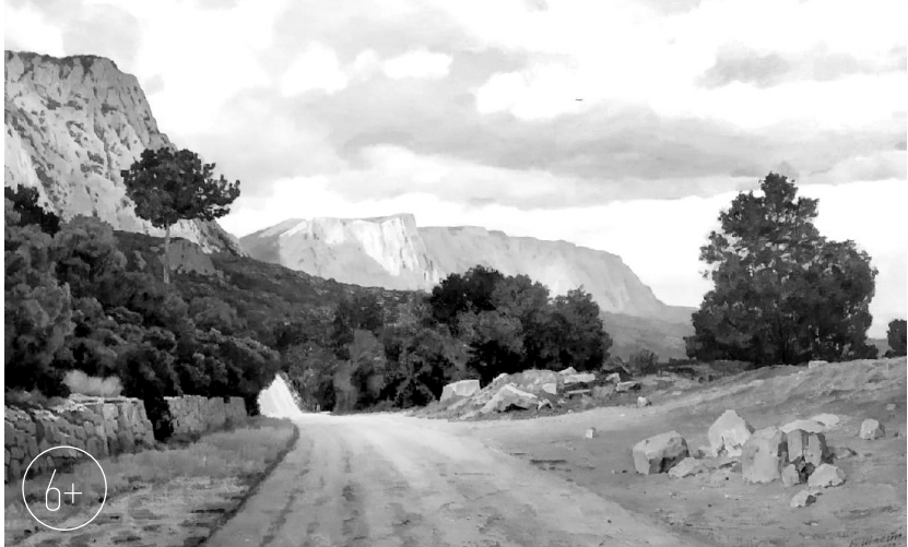
«Дорога к Байдарским воротам»