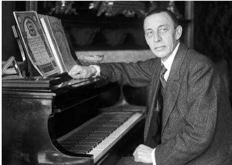
В 2013 году музыкальный мир отмечает 140 лет со дня рождения Сергея Рахманинова.

Первая симфония Рахманинова, которую он представил петербургской публике в марте 1887 года, с треском провалилась. Рецензии на нее были настолько критически, что композитор впал в глубокую депрессию и ему потре-