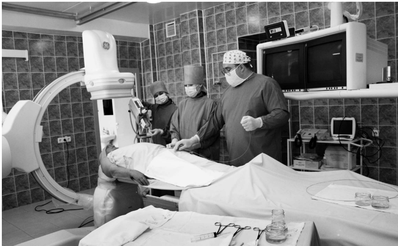
В операционной областной клинической больницы

Всероссийские съезды по охране окружающей среды не проводились уже десять лет. За это время существенно изменилось экологическое законодательство, отношение к вопросам экологии. Участникам IV съезда предстоит рассмотреть актуальные вопросы охраны окружающей среды в свете современных требований к состоянию экологии.