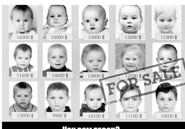
Как вам товар?