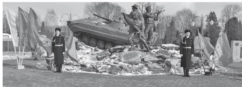
Вечная память и слава героям!

К собравшимся обратился и спикер региональ-