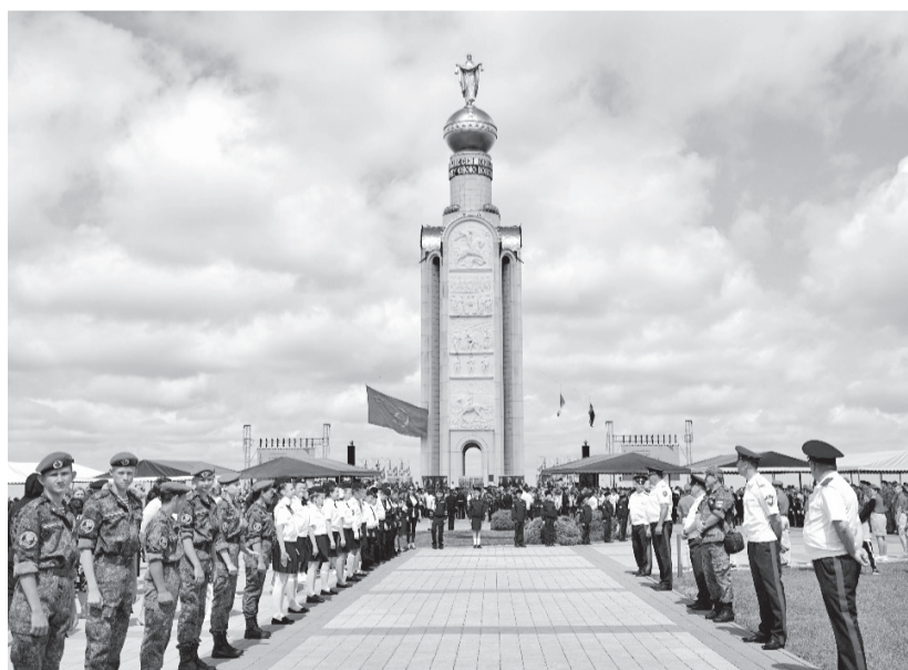
252-метровая Звонница мемориального комплекса «Прохоровское поле» создана в память о павших в грандиозном танковом сражении 12 июля 1943 года