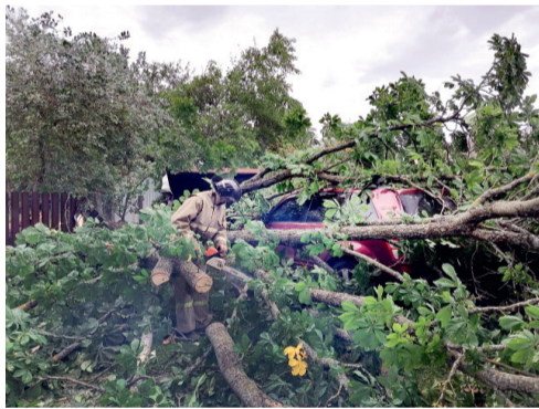
После разгула стихии

гиона. Энергетики активно устранили неполадки.