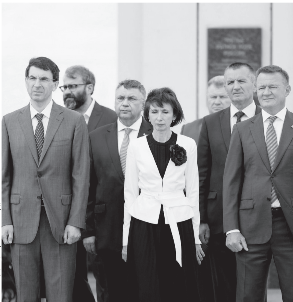
Поклонимся за тот великий бой!