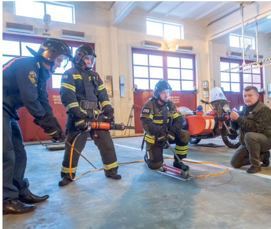
Журналисты в роли спасателей