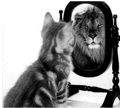
Все чаще в зеркало гляжу, Глазам своим не веря, И в отражении своем Всегда я вижу зверя!

СЕГОДНЯ МЫ ОБЪЯВЛЯЕМ ИМЕНА ПОБЕДИТЕЛЕЙ НАШЕГО КОНКУРСА, ПРИСЛАВШИХ САМЫЕ ИНТЕРЕСНЫЕ ПОДПИСИ К ОПУБЛИКОВАННЫМ В МАЕ СНИМКАМ. ИТАК, ИМЕНА ПОБЕДИТЕЛЕЙ: