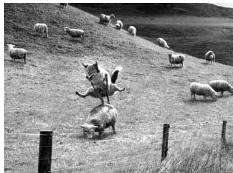
Хватит, овцы, есть траву, Поиграем в чехарду.