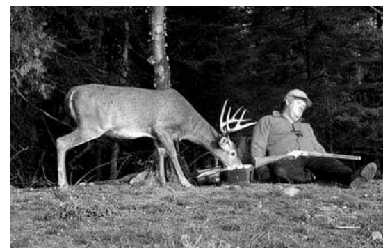
Пока он спит, угрозы нет, Могу я съесть его обед.