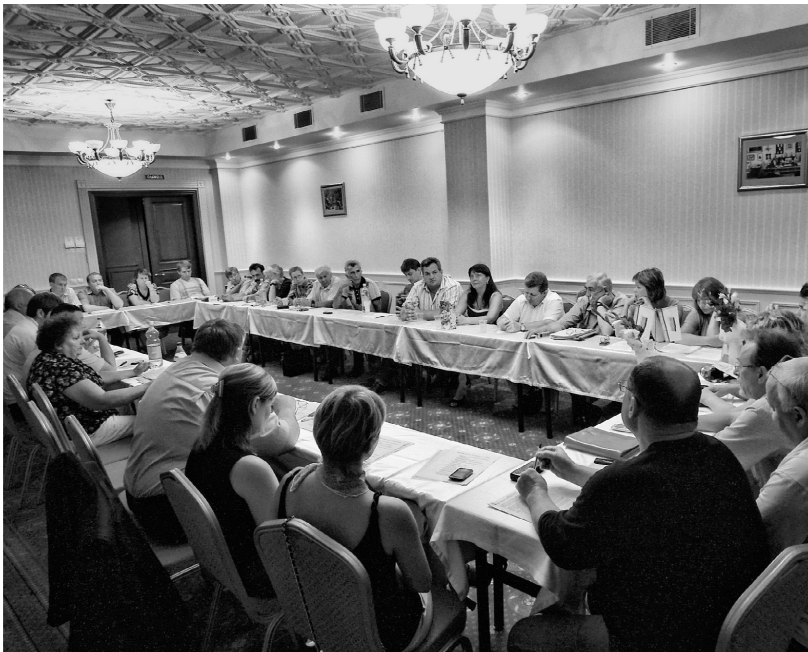
Пожалуй, более половины присутствовавших на так называемом антикоррупционном форуме составили работники СМИ