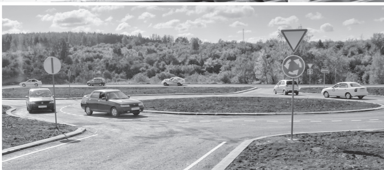
Будущим водителям есть где развернуться на 20 тысячах квадратных метров

Тем временем на импровизированной сцене шел концерт с участием студентов техникума.