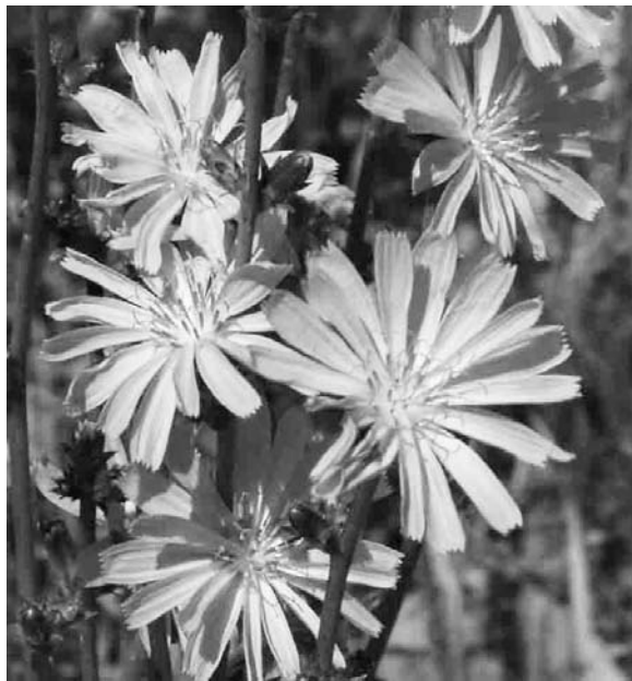
цикорный напиток можно пить даже перед сном.

В народной медицине отвар и настой корней принимают, чтобы улучшить пищеварение. Используют их при нарушениях обмена веществ, кожных заболеваниях, болезнях печени и почек, как легкое желчегонное, мочегонное и слабительное. Отвары и настои оказывают успокаивающее действие на нервную систему, усиливают сердечную деятельность, замедляют ритм сердечных сокращений, поэтому