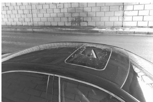
Фото с места происшествия