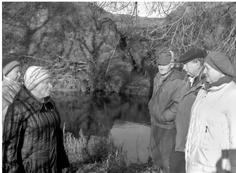
— Теперь мы будем вдыхать «ароматы» канализации и купаться в нечистотах? — возмущаются «мичуринцы»

Дело в том, что сброс сточных вод планируется в реку Ливенку рядом с СТС. А как сообщают в своём письме в «Орловскую правду» члены СТС, в этом месте они «брали воду для своих нужд, ловили рыбу, отдыхали и купались». «Теперь мы будем вдыхать «ароматы» канализации и купаться в нечистотах?» — возмущаются люди (письмо подписали 39 человек).