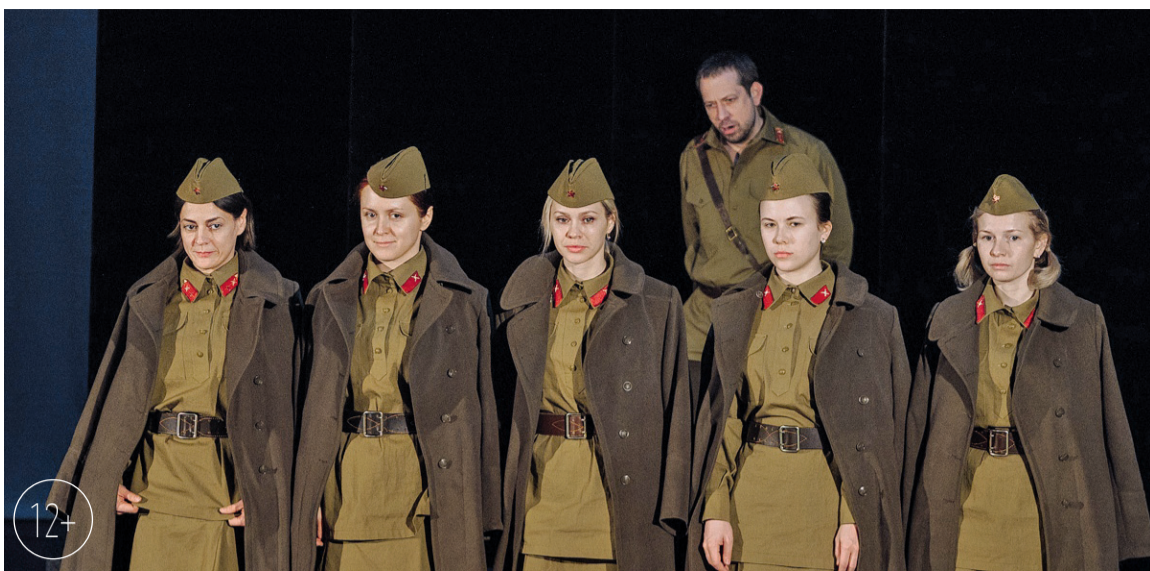
Фрагмент репетиции премьерного спектакля