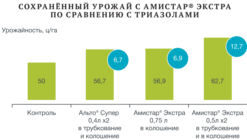
Рис. 1. Яровой ячмень, сорт Скарлетт, 2005

Однако, как показали фитопатологические обследования, выявлен достаточно большой потенциал возбудителей фитопатогенных заболеваний. Так, на сортах Тревелер, Квенч, Эльф, Беатрис, Атаман, Грейс обнаружено развитие сетчатой пятнистости (до 20–40%) у 10–20% посевов, несколько меньше (развитие до 10% у 5% растений) данное заболевание отмечали на сортах Калькюль, Чил, Эксплорер, Аннабель, Гелиос и Пионер. Темно-бурая гелиминтоспориоз выявлен на сортах Квенч, Пионер, Щедрый — развитие до 10–30% у 10–15% растений. Ринхоспориоз активно нарастает на сортах Беатрис, Скарлетт и Маргарет (пока на 5–10% у 10–15% растений). Всё чаще в посевах ячменя отмечаются очаги с поражением стеблей прикорневыми гни-