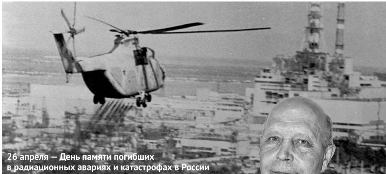
26 апреля — День памяти погибших в радиационных авариях и катастрофах в России