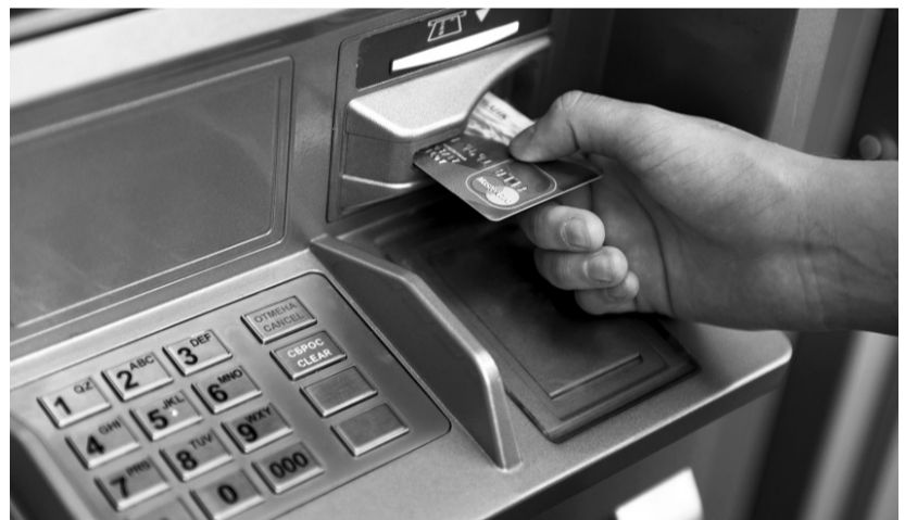
Разумнее не пользоваться банкоматом, установленным в подозрительном месте

— Необходимо направить свои претензии в письменном виде в организацию, данные которой указаны в чеке. Нужно обязательно указать дату и время проведения операции, местонахождение устройства и, ко-