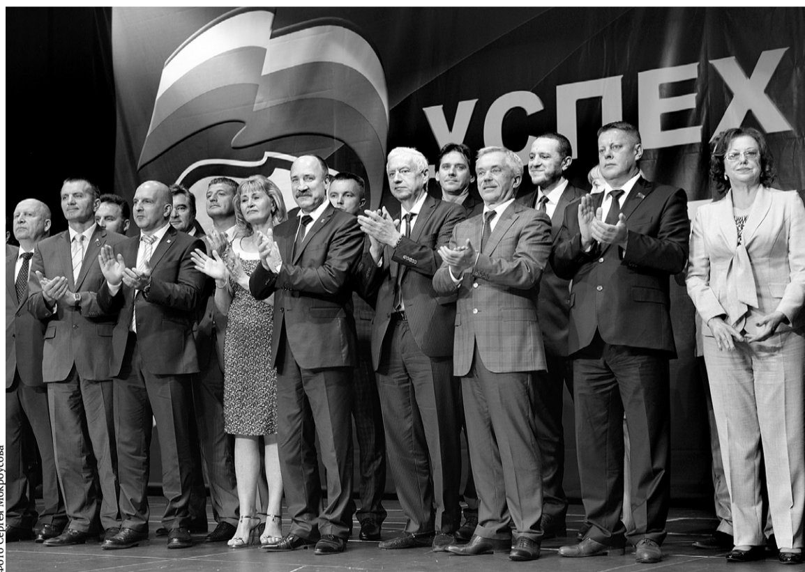
Впереди — большая работа

В ТМК «ГРИНН» прошёл региональный форум Всероссийской политической партии «Единая Россия».