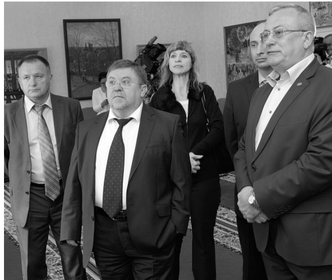
Работы молодых художников приятно удивили