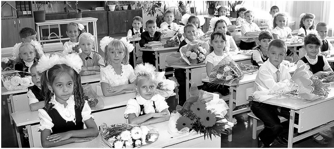
«Книжки добрые любить и воспитан- ными быть учат в школе»