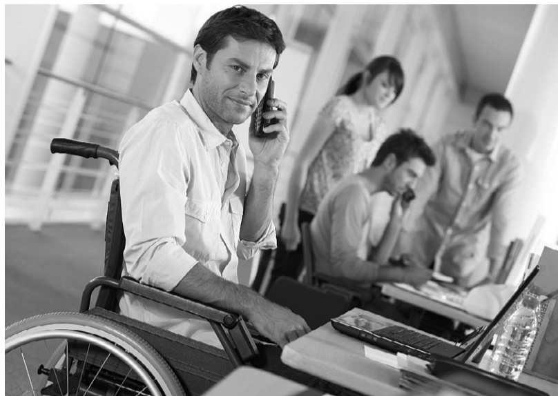
За последние три года 90 инвалидов прошли бесплатное профессиональное обучение по направлению центров занятости

Основная причина — дисбаланс между спросом и предложением. Квотируе-