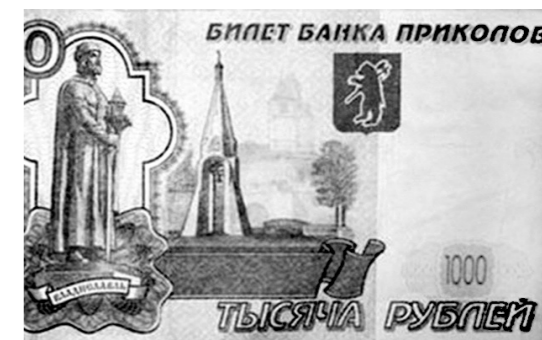
Билет банка приколов старушка приняла за настоящую купюру

Лишь через четыре дня бабушка рассказала сыну об удачном обмене, тот заподозрил неладное и попросил показать деньги. Увидев 69 сувенирных купюр номиналом по 1000 рублей, мужчина схватился за голову и отправил мать в полицию писать заявление.