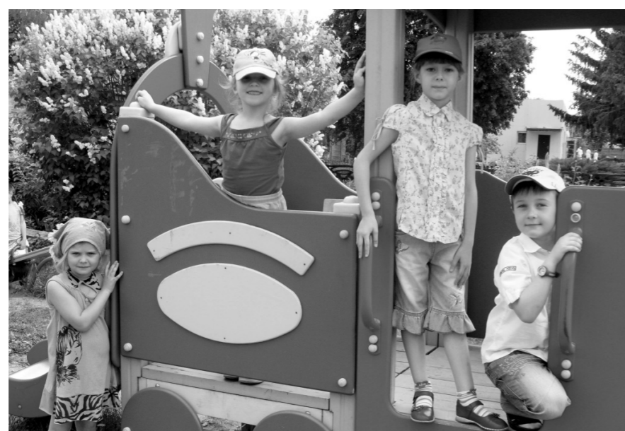
Пока эти малыши управляют паровозом игрушечным, но настанет время — справятся и с настоящей

И дети искренне мечтают пойти по их стопам. Они гордятся своими папами и мамами, а те не