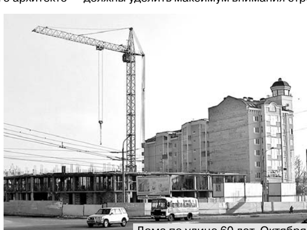
Дома по улице 60 лет Октября.

ческого института, оградить их забором, — подчеркнул П.А. Меркулов. — Что касается Наугорского шоссе, то здесь мы должны уделить максимум внимания стро-