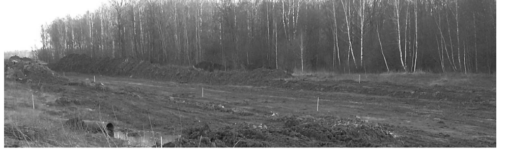
Так сейчас выглядит дорога, по которой можно было добраться до райцентра. Вместо нее строят объездную.

Разумеется, не дело. Там лужи, грязь, да и дороги-то никогда не было. А если пожар в поселке? Или кому-то ста-