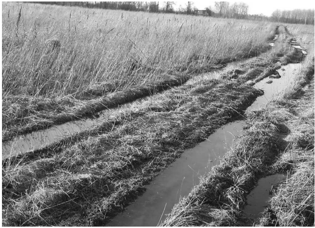
Колея по полю, по которой жителям предлагают ездить местные власти