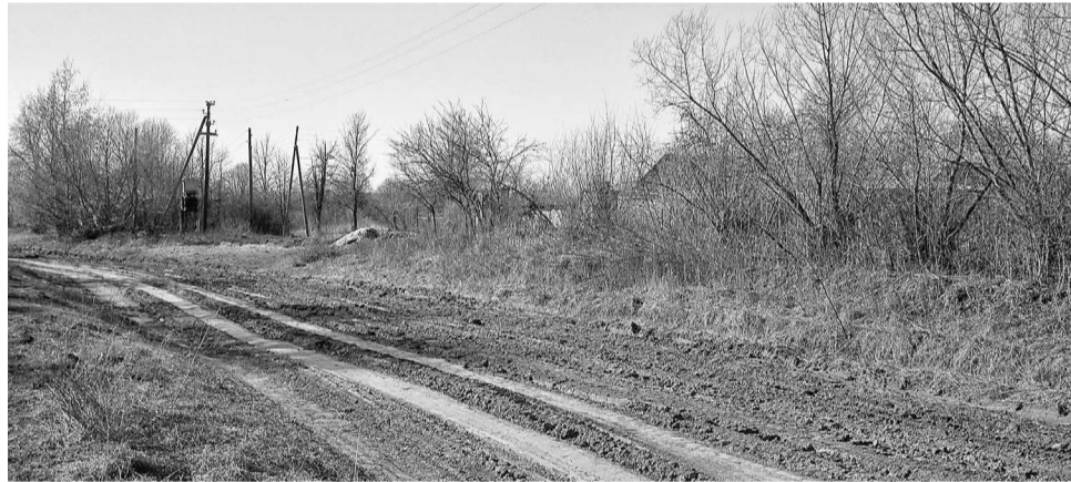
От села Горки до трассы всего 400 метров, но дорогу здесь так и не построили