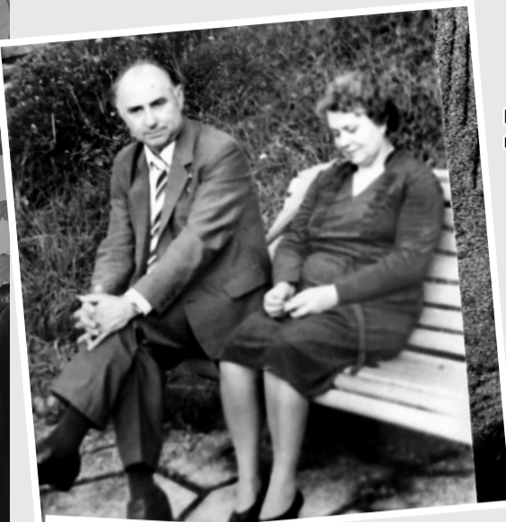
В санатории в Сочи