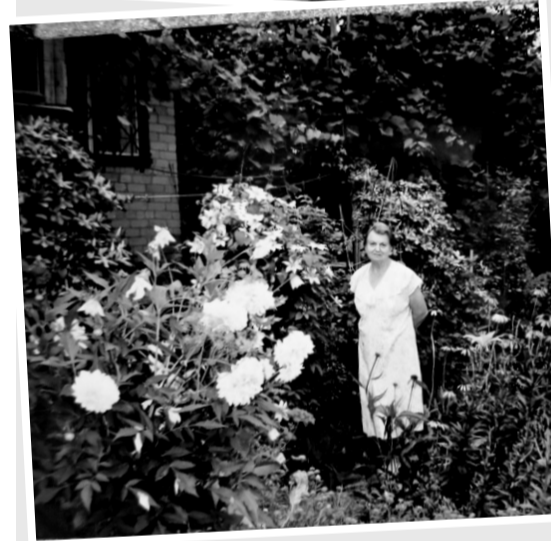
Дача в цветах

«Настоящая любовь, говорят, даёт человеку лишь раз, как его собственная жизнь. Может быть, просто надо научиться всё это ценить и беречь?»