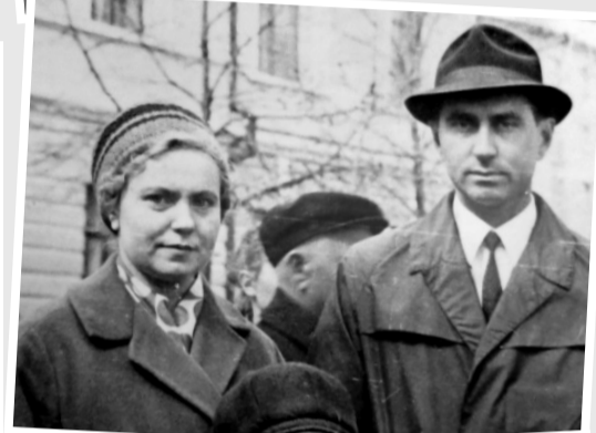
На параде в Орле