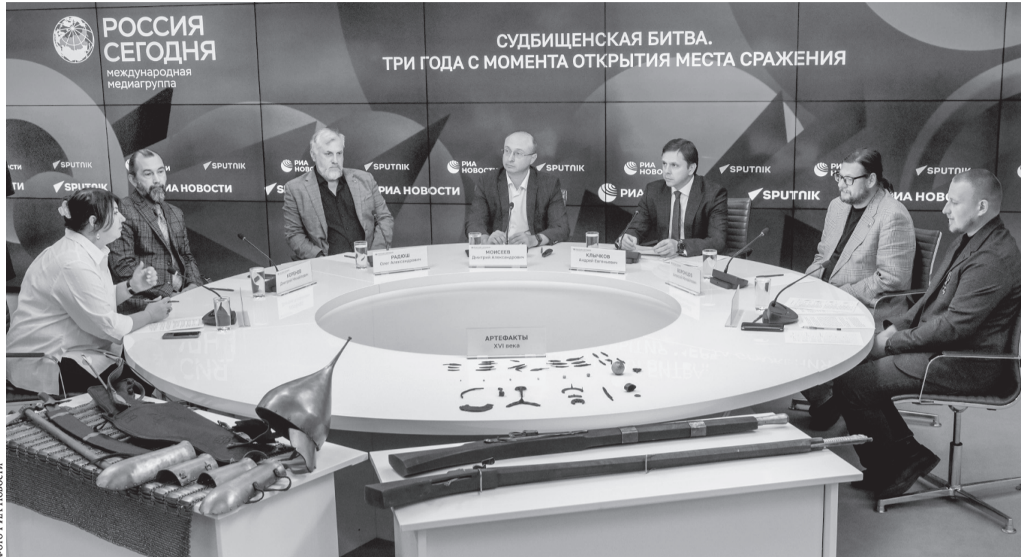
Судбищенская битва — яркая страница мировой истории

Он подчеркнул, что работа по созданию в регионе мемориального комплекса, посвящённого Судбищенской битве, ведётся при поддержке Председателя Правительства РФ Михаила Мишустина и Министерства культуры РФ.