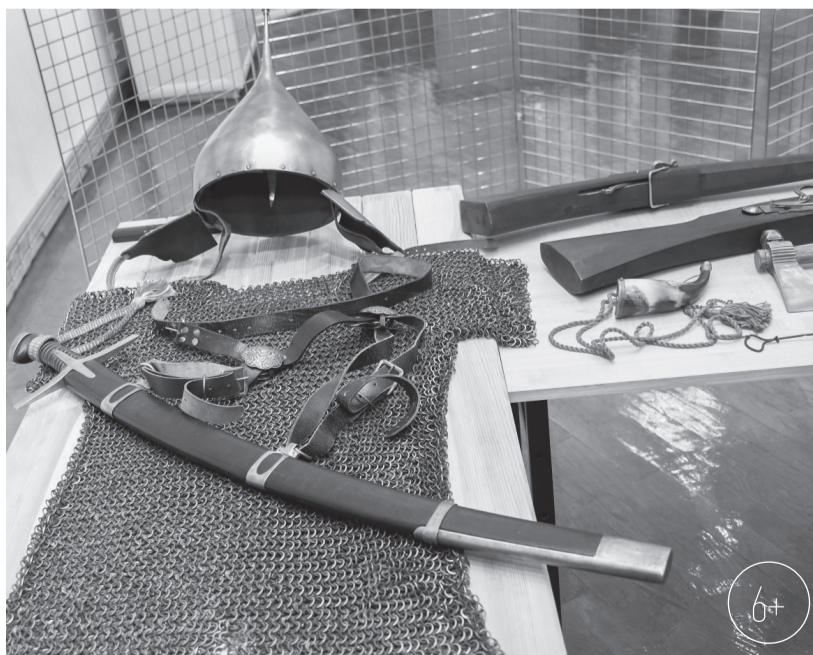
Фрагменты новой экспозиции «Судбищенская битва»

лось открытие выставочного зала с новой экспозицией, посвящённой Судбищенской битве. Это первый этап работ по созданию будущего мемориального комплекса.