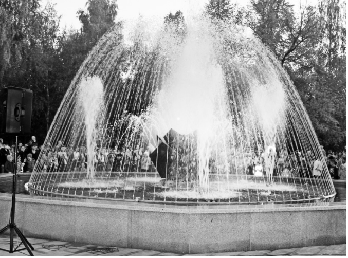
Жемчужина парка Машиностроителей — музыкальный фонтан

Помимо учебных классов, спортивного зала, библиотеки, столовой в нём размещалась когда-то и внутренняя церковь. Трагическая и апсида её узнаваемы до сих пор. Вообще, Ливны были богаты учебными заведениями. Здесь в XIX веке открылись реальное училище (1873 г.), женская гимназия (1889 г.), несколько приходских и частных школ. Здания сохранились, о них можно прочитать в книге. Церкви, которых в довоенное время в городе насчитывалось 11, так же, как и большинство архитектурных памятников, были уничтожены во время Великой Отечественной войны.