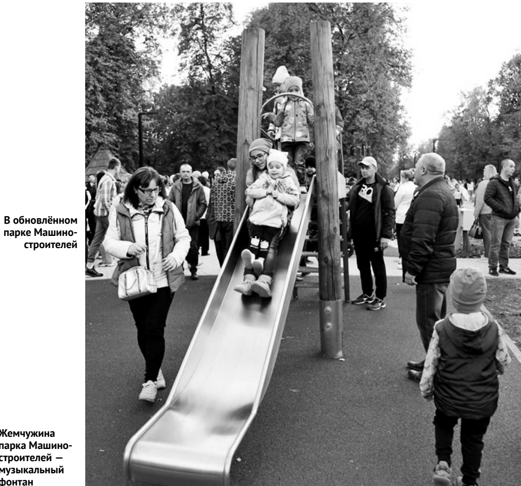
В обновлённом парке Машиностроителей

В Ливны многие дома — памятники истории и архитектуры. Одним из заповедных можно назвать здание духовного училища (1903 г.), в котором ныне размещается школа-лицей № 3.