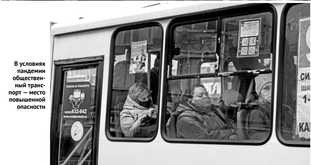
В условиях пандемии общественный транспорт — место повышенной опасности

— Нарушение мы также зафиксировали при помощи фотосъёмки. Теперь у нас есть все основания привлечь к ответственности перевозчика. Мы его вызовем, составим протокол о нарушении масочного режима, допущенного водителем, и к ответственности будет привлечено уже не физическое лицо, а организация — в этом случае ИП. Штрафы здесь уже другие: при повторных нарушениях — от 30000 рублей. А на юридических лиц — от 50000 рублей и выше, — говорит руководитель управления дорожного хозяйства, транспорта и реализации государственных строительных программ профильно-