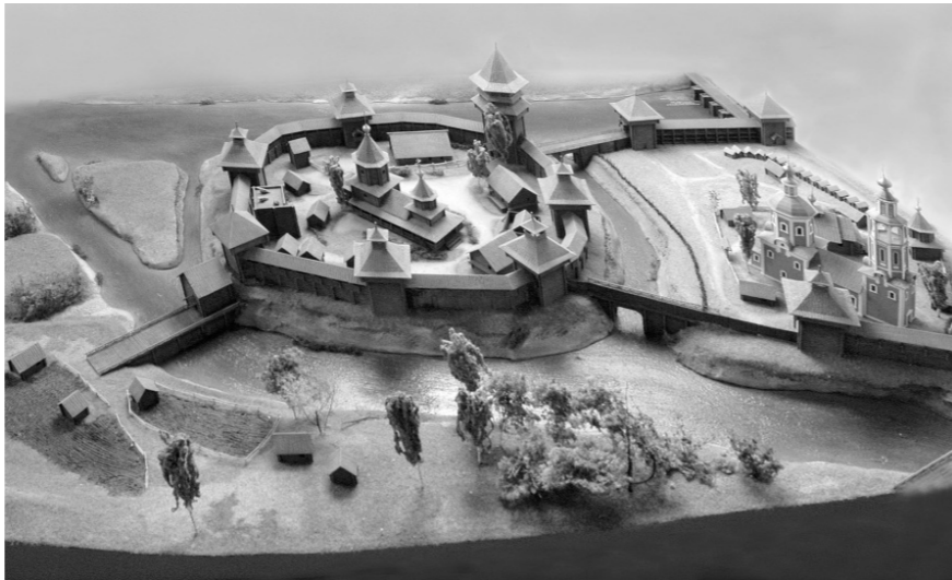
Макет Орловской крепости XVI века

— Помимо знакомства с экспозицией музея, обсуждался актуальный вопрос реставрации Торговых рядов, где располагается музей. Ольга Борисовна поддержала предложение губернатора Орловской области Андрея Клычкова создать на базе Торжественных рядов музейно-образовательный комплекс, который объединит экспозиционно-выставочные площадки музея и городские пространства. Комплекс станет единым местом экспонирования артефактов, найденных во время археологических раскопок на месте Судбищенской битвы 1555 года и территории Орловской крепости. В комплекс также войдут благоустроенные территории детинца Орловской крепости и прилегающего к музею сквера коммунальщиков. В случае реализации проекта площади музея для хранения фондов увеличатся вдвое, экспозиционно-выставочные — втрое, а на первом этаже будут размещены центры —