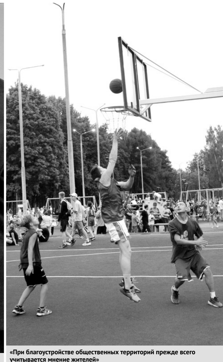
«При благоустройстве общественных территорий прежде всего учитывается мнение жителей»