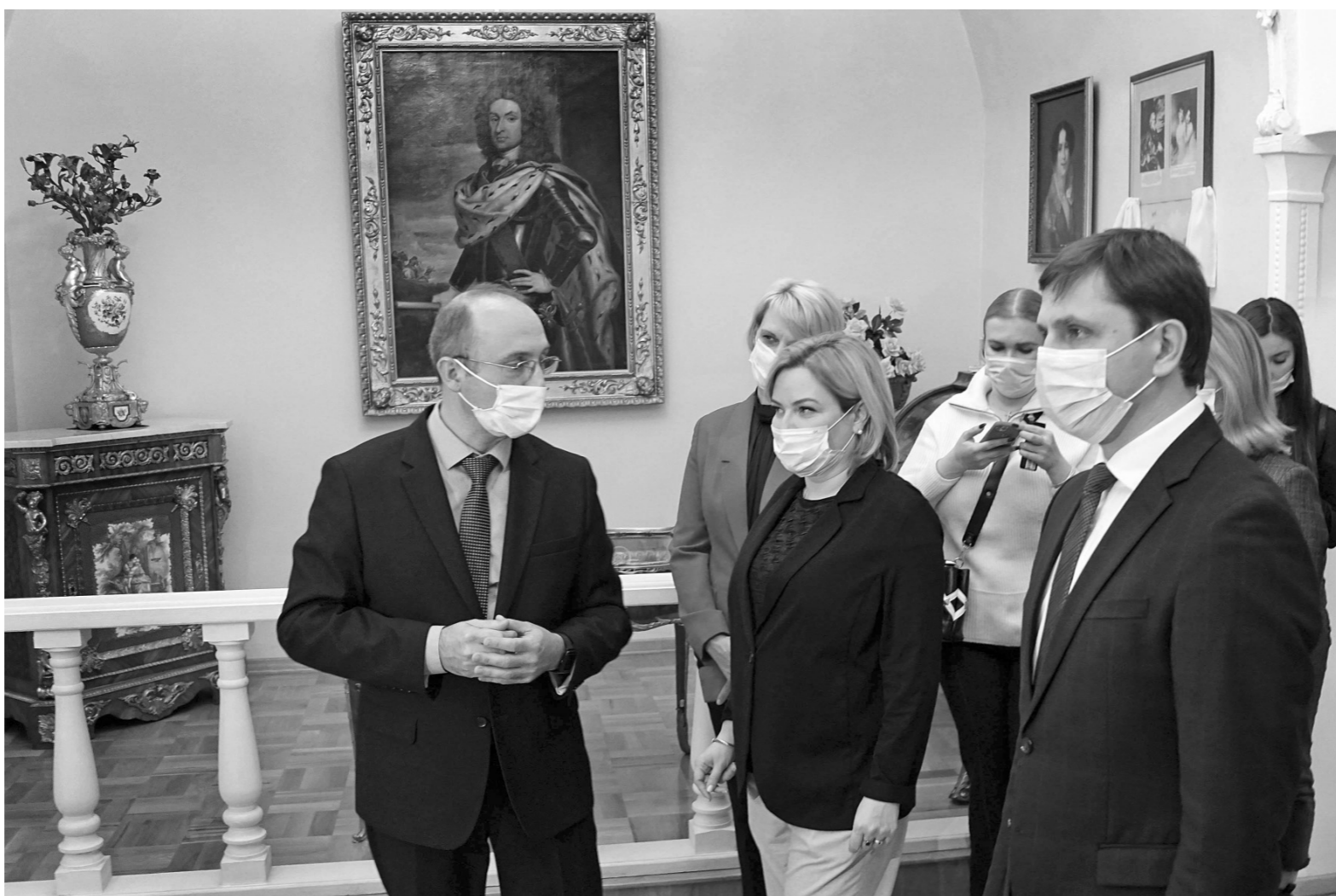
Министр культуры РФ Ольга Любимова, что Орловский краеведческий — музей с большими перспективами

Нельзя не вспомнить и самые трагические страницы, связанные с Великой Отечественной войной, эвакуацией и реэвакуацией музейных ценностей. В этот период мы потеряли значительную и ценную часть коллекций. В 2002 году под эгидой Министерства культуры России был издан 9-й том Сводного катало-