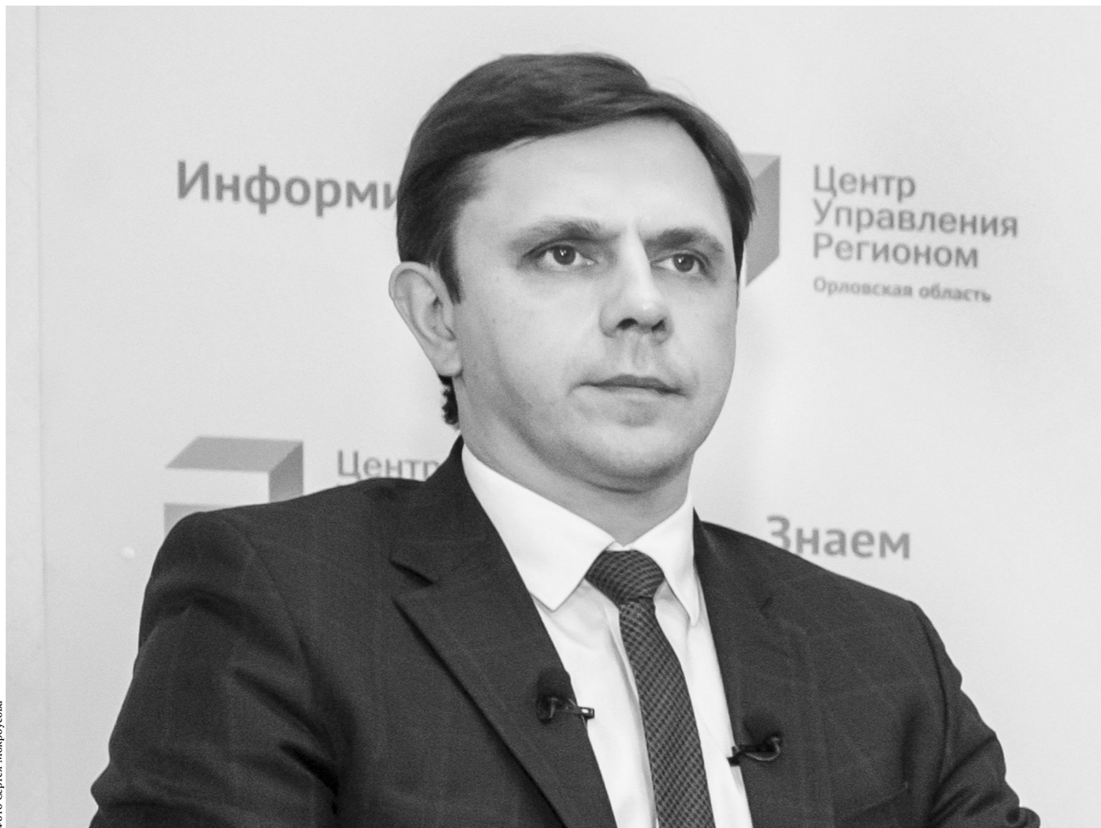
Андрей Клычков: — За четыре года работы на Орловщине многое удалось изменить в лучшую сторону, но ещё больше предстоит сделать!

Нам удалось договориться о достройке многопрофильного медицинского центра