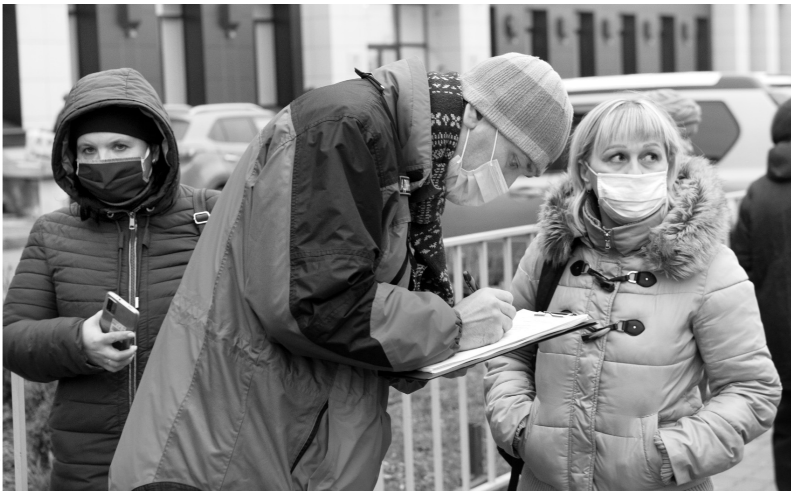
Составление протокола — как шанс достигнуть до сознательности пассажиров

К остановке тем временем подъезжает маршрутка № 26. Здесь без маски уже водитель.