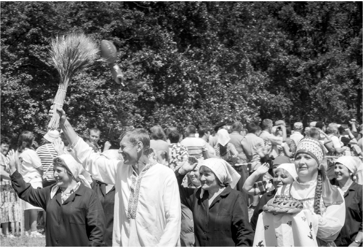
Хлебом-солью, радушием и задорными наигрышами встречали гостей должанцы