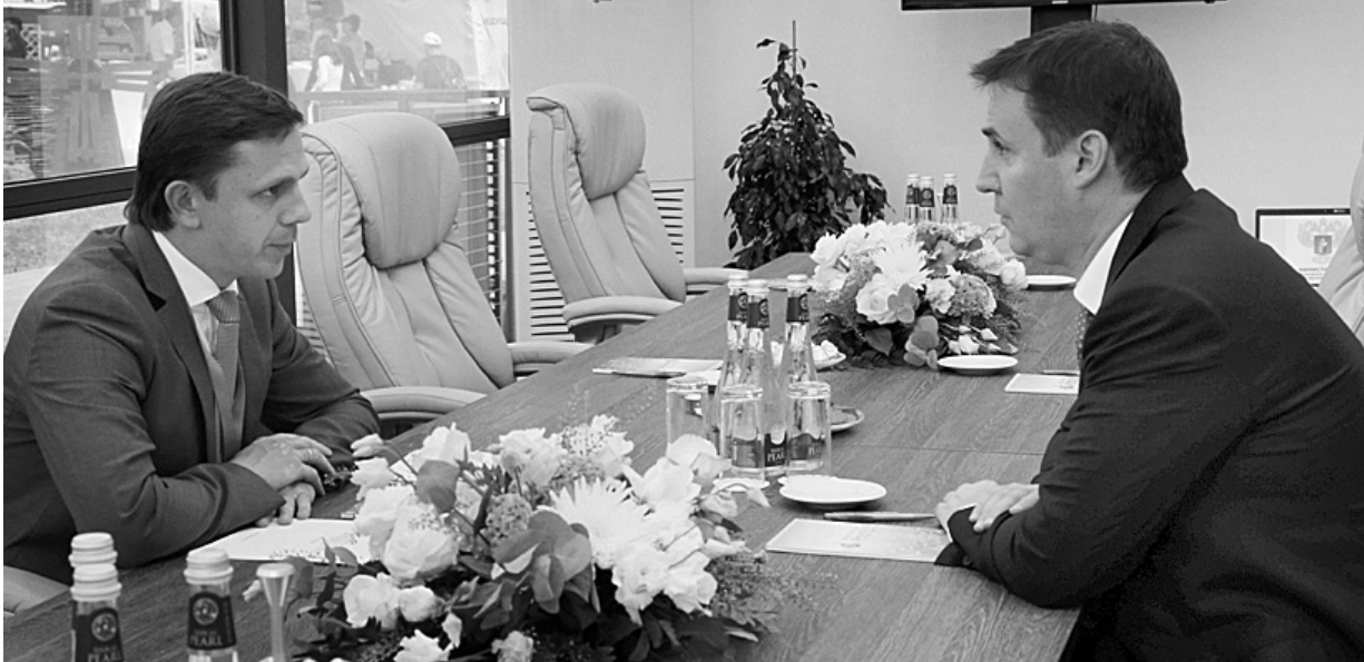
Андрей Клычков поблагодарил Дмитрия Патрушева за поддержку в развитии сельского хозяйства Орловской области

Делегацию Орловской области возглавил глава региона Андрей Клычков. Он принял участие в совещании Минсельхоза РФ, на котором обсуждались проведение уборочных работ и стратегия развития растениеводства. Обращаясь к участникам форума, Дмитрий Патрушев отметил, что в этом году неблагоприятные погодные условия оказывают влияние на урожайность сельхозкультур. — Наша задача — провести уборочные работы в сжатые сроки и с минимальными потерями, — подчеркнул глава Минсельхоза РФ. Он также сообщил, что в 2018 году на поддержку сельхозтоваропроизводите-