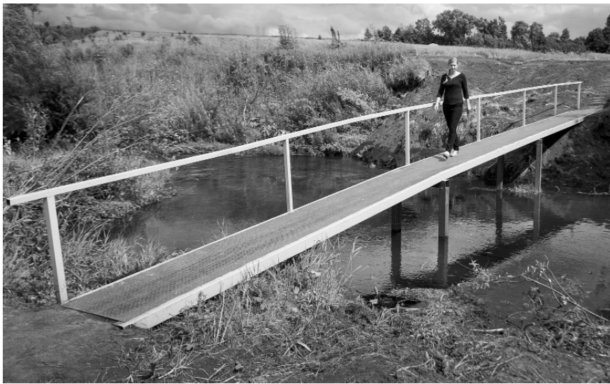
По такому мосту не то что ходить — ездить не страшно

Многие годы правый и левый берега реки — Ступишино и Лукьянчиково — связывал мост. Как правило, это был временный самодельный переход через водную преграду: с берега на берег перекидывали два бревна, сбивали их досками — и ходи себе, народ, не горюй.