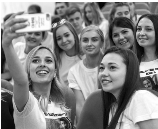
Профсоюзная молодёжь — весёлая и активная