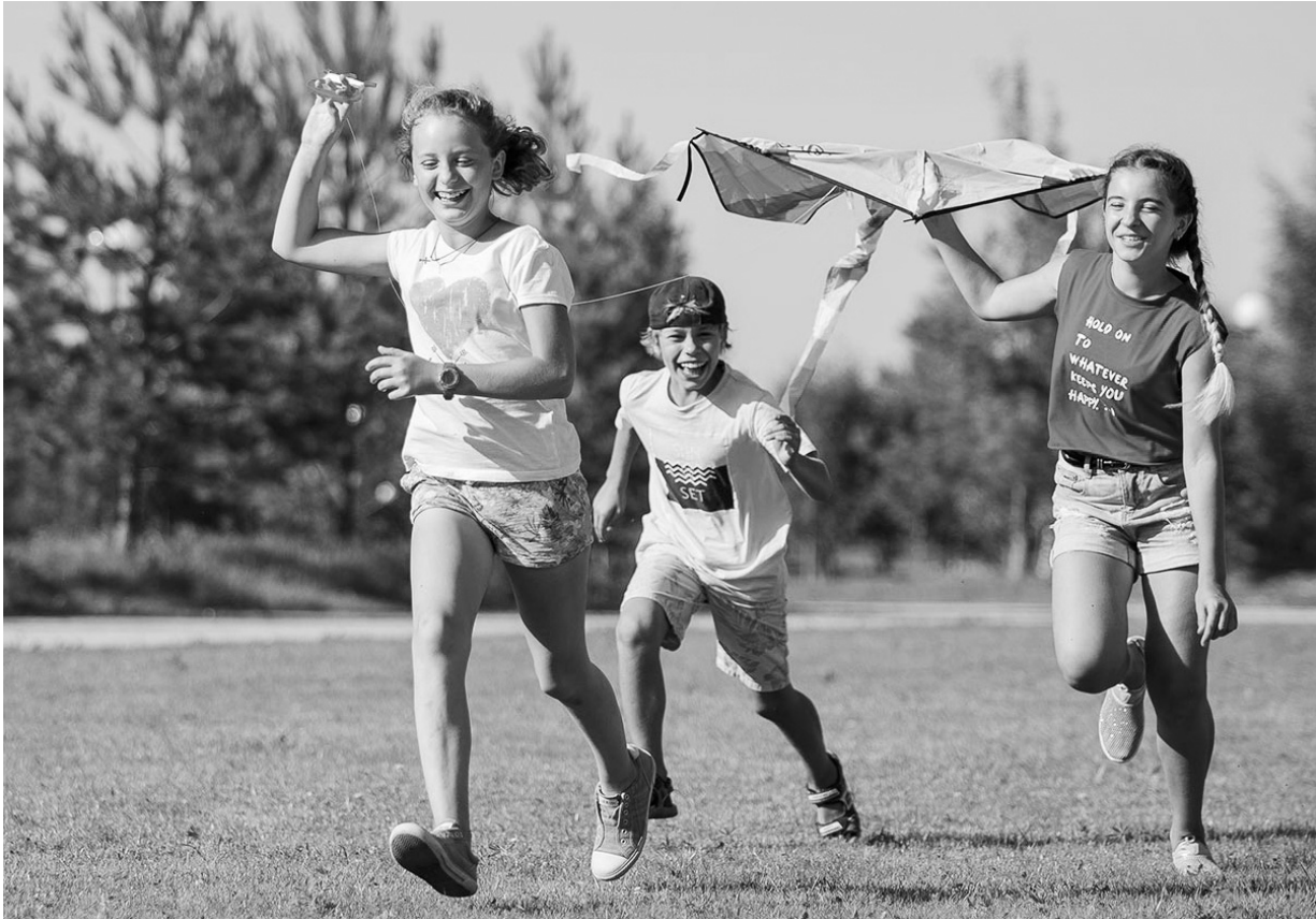
Цвет настроения — лето

Неналоговые и налоговые поступления в бюджет в 2019 г. составят 19 млрд. 186 млн. рублей (61,5 % от общего объёма доходов). Безвозмездные поступления — в объёме 12 млрд. 36 млн. рублей (38,5 % от общего объёма доходов). Расходы за счёт собственных доходов областного бюджета планируются в объёме 25 млрд. 792 млн. рублей (83 % от общего объёма рас-