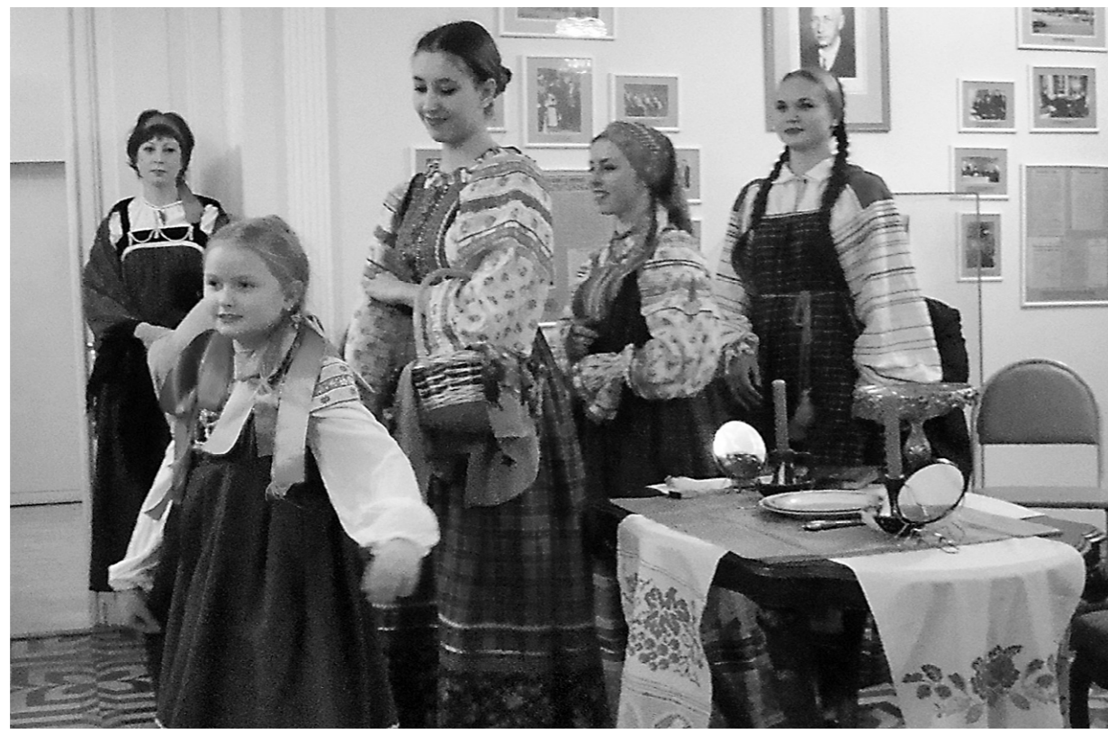
Гостей встречали, песнями величали