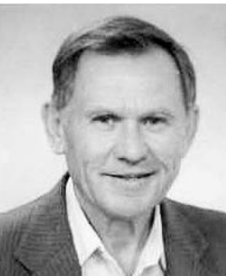
Дело авторитетной комиссии — изучить, обсудить и оценить творчество нашего земляка.