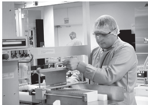
Орловские инсулины расходятся по всей стране

ской области за поддержку и содействие в реализации крупного проекта по строительству второй очереди завода.