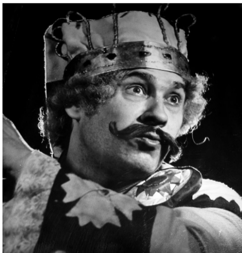
Царь из комедии-сказки «Левша»