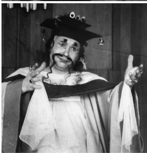
Император Альтоум в «Принцессе Турандот»