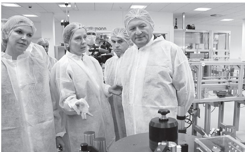
Борис Титов был впечатлён современным производством на «Санofi Авенчис-Восток»