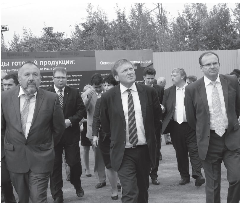
На производственной площадке ООО «Промметиз Русь»

Он выразил признательность правительству Орлов-