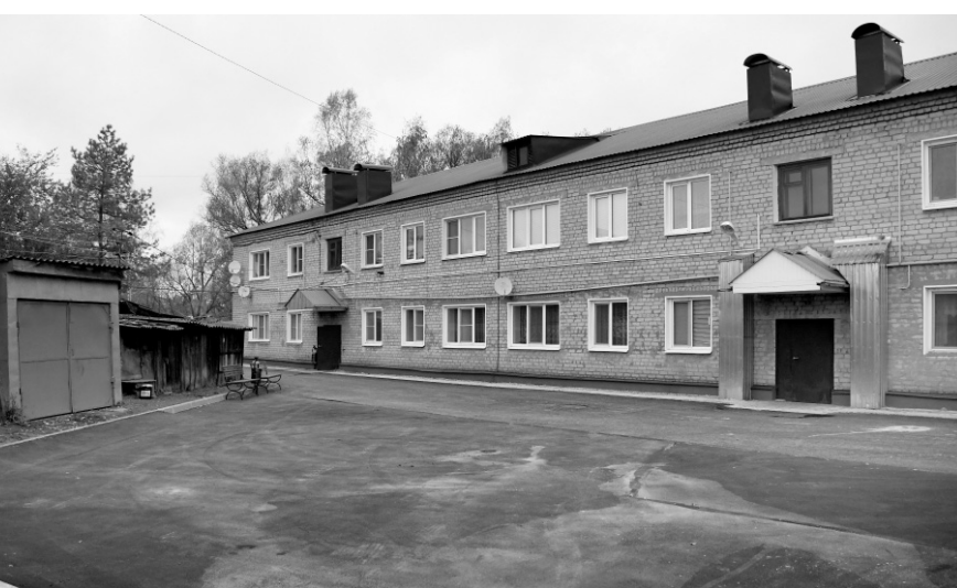
Этот двор на улице Комсомольской, где ещё недавно шли работы, радует глаз