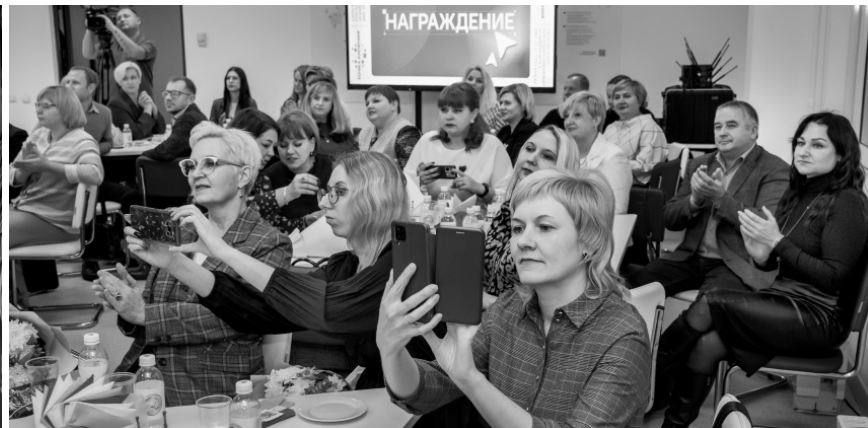
Среди награждённых — администраторы лучших госслужащих региона и блогеры