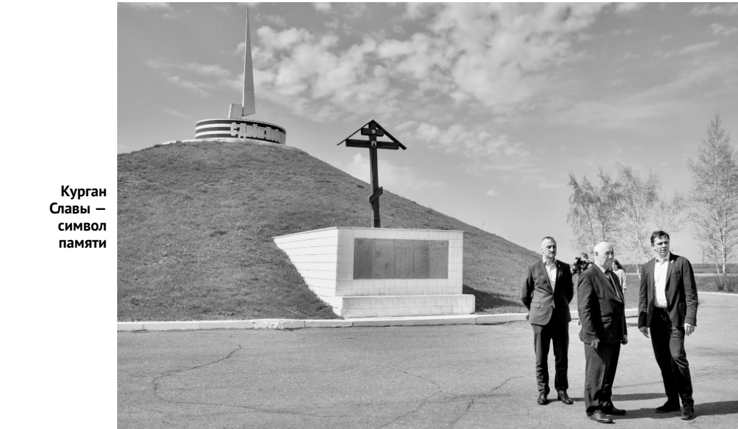
Курган Славы — символ памяти

Это самая крупная школа в Ливенском районе. В ней обучаются 334 ребёнка, работают 54 педагога. Здание построено в 1960 году, и с тех пор капремонт не проводился.