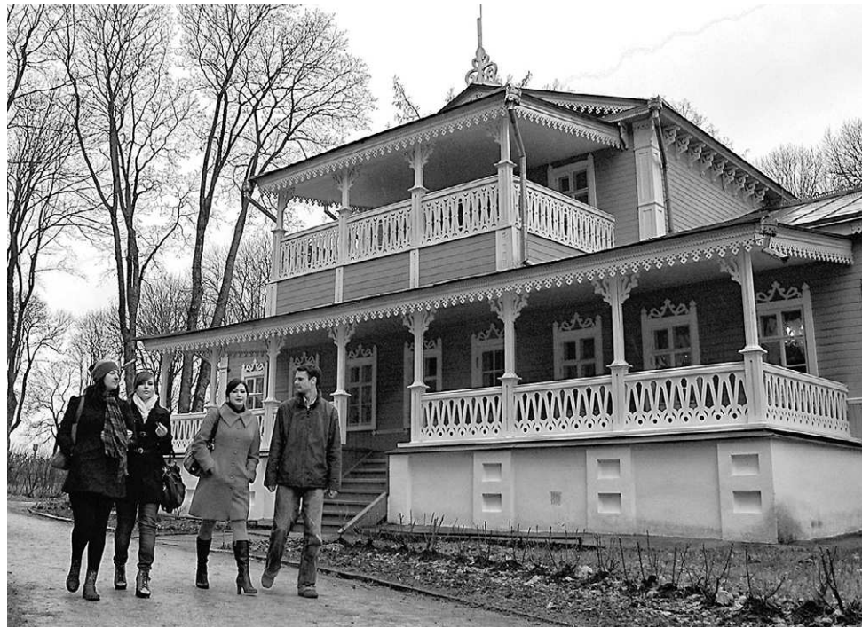
На аллеях старинного парка всегда многолюдно

Среди раритетов — личные вещи классиков русской