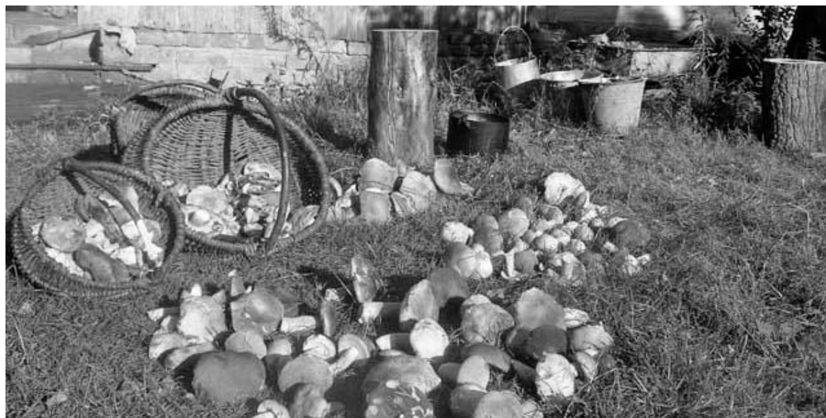
г. Орел.

Наш адрес: 302000, г. Орел, ул. Брестская, 6, к. 33.