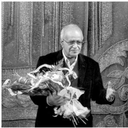
поддержки русского театра за рубежом, ситуация изменилась кардинально.

— Конечно, мы стали больше быть в курсе театральных процессов в России. Мы стали чаще выезжать, чаще видятся с коллегами из других регионов. И к нам стали чаще приезжать. Раньше мы изнывали оттого, что не было выхода на Россию. Удивительно дело: в российском посольстве нет атташе по культуре, а в немецком, французском, израильском есть. Складывалось такое впечатление, что Россия не очень-то заботится о сохранении языкового, культурного пространства на территории нашей республики. И это, конечно, угнетало. А сейчас, когда образовался центр