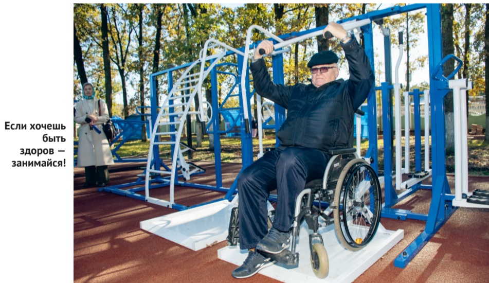
Если хочешь быть здоров — занимайся!