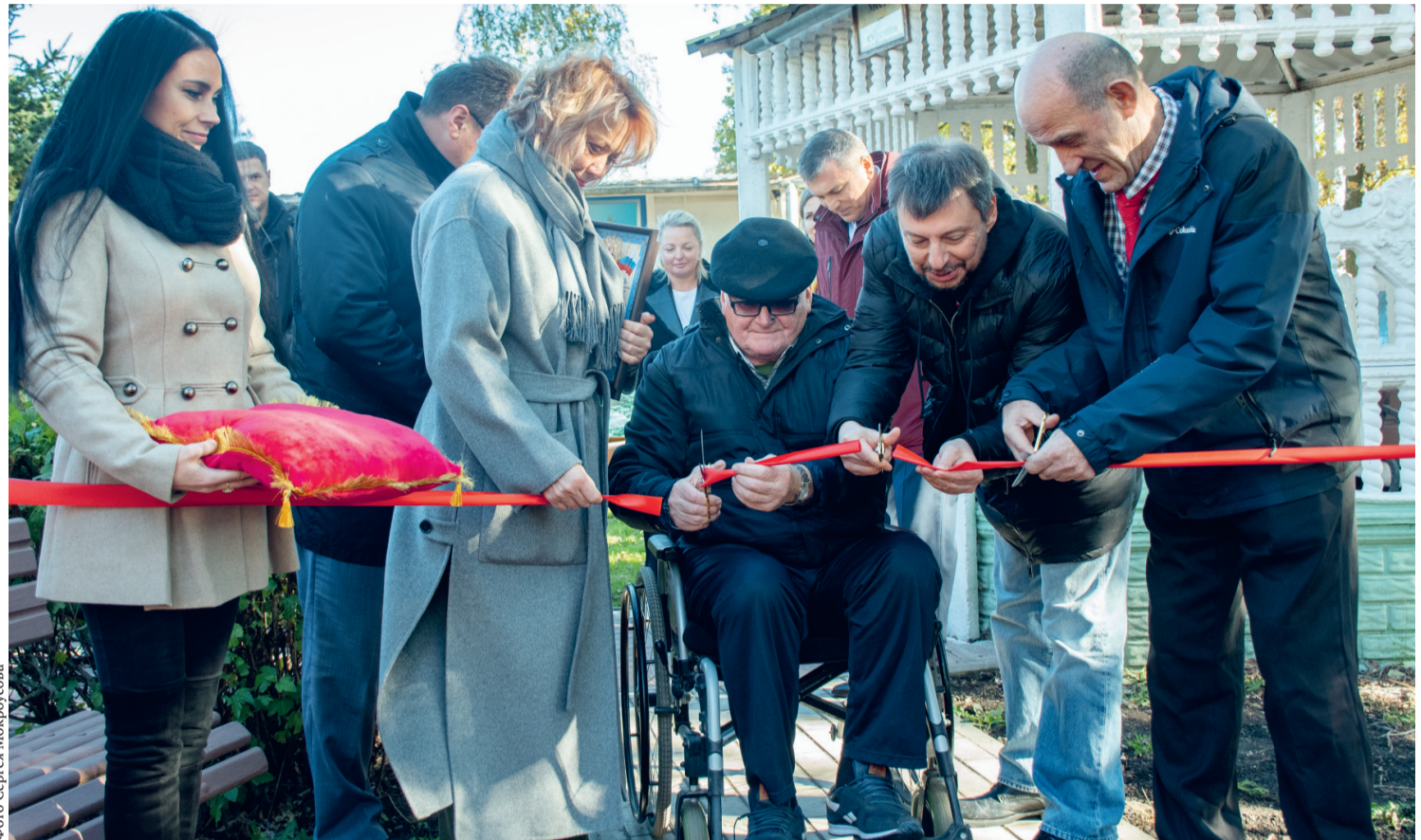
Доброе событие в посёлке Добром

17 октября на открытие адаптивно-спортивной площадки в областной геронтологический центр приехали представители правительства Орловской области, благотворительного фонда «Память