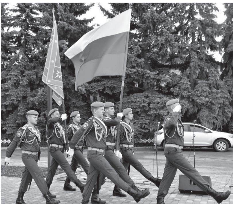
Торжественным маршем прошла знаменная группа