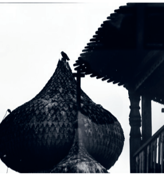
судёнышка на Соловках, полуразрушенный церковный купол, летающее вокруг воронье...

— Это началось не сейчас, в 1960-е годы, когда Хрущёв начал гасить деревню. Умирали маленькие сёла, от них остались забытые добротные дома, брошенные маленькие электростанции, — говорит Малых. — Но что-то и возрождается.