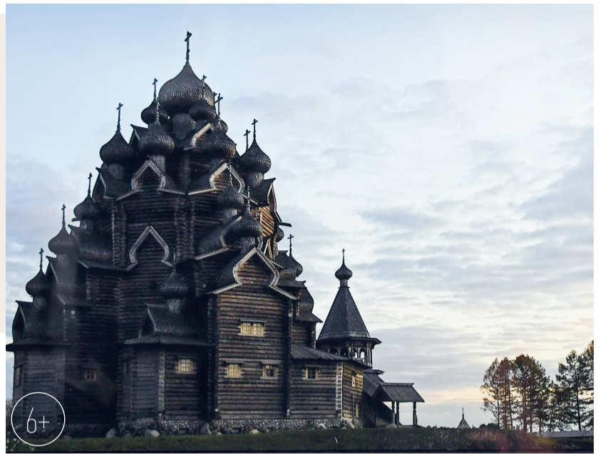
«Новодел». Церковь Покрова Пресвятой Богородицы, 2004–2008 гг., Невский лесопарк, Ленинградская обл.