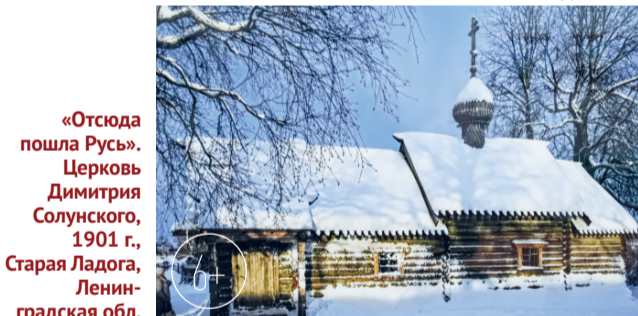
«Отсюда пошла Русь». Церковь Димитрия Солунского, 1901 г., Старая Ладога, Ленинградская обл.

выставки была другая задача — показать именно дерево.