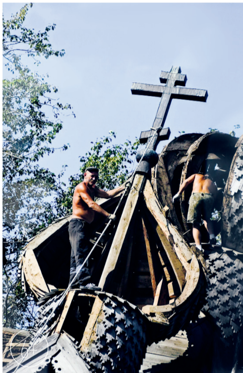
«Запустение». Церковь Димитрия Солунского, 1783 г., Щелейки, Ленинградская обл.