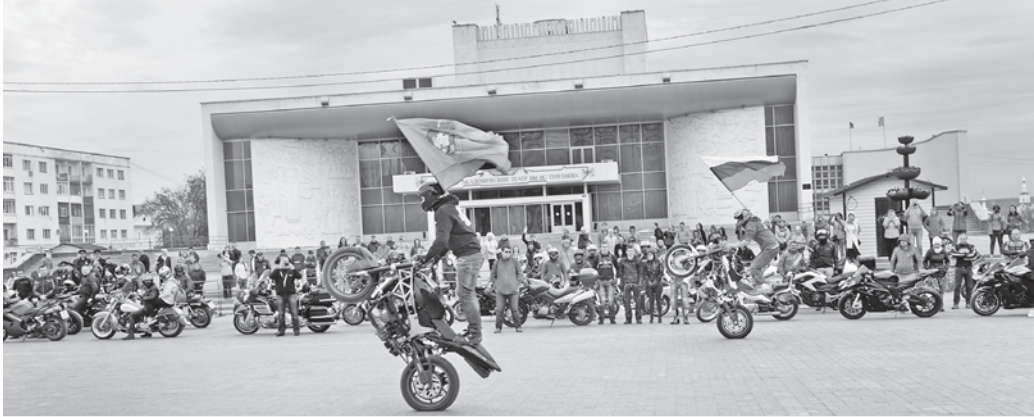
Показательные выступления байкеров на площади им. Ленина