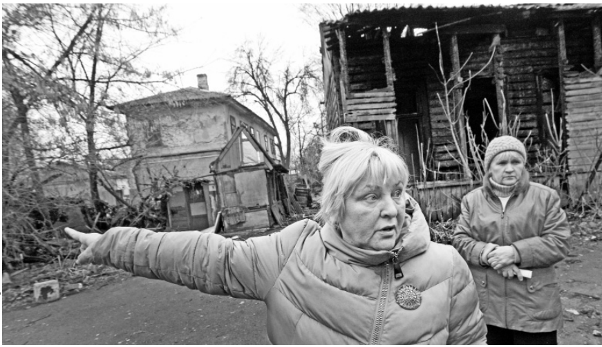
Жители ул. Карачевской: — Наши дома находятся совсем близко и тоже могут сгореть