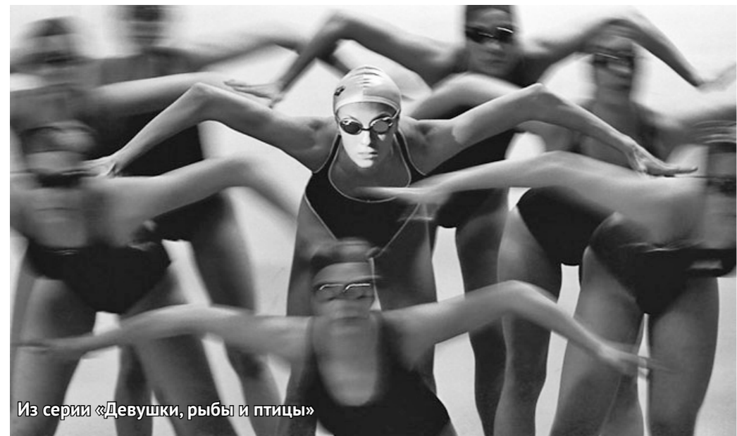
Из серии «Девушки, рыбы и птицы»

стрел: повзрослевшая маленькая пловчиха с первого снимка теперь стоит вся увешанная медалями, которые с завистью рассматривают девочки нового набора. Но кто будет ждать таких фотосюжетов столько лет — вот вопрос.