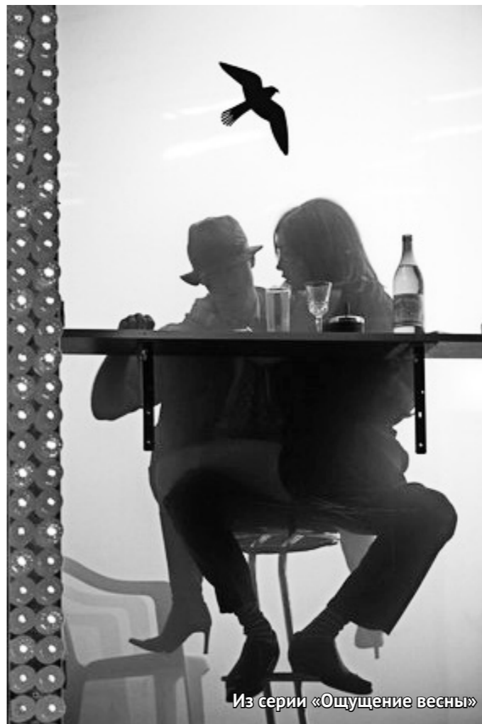
Из серии «Ощущение весны»

Прекрасен в своей борьбе за жизнь и здоровье маленьких пациентов и доктор в серии Владимира Вяткина